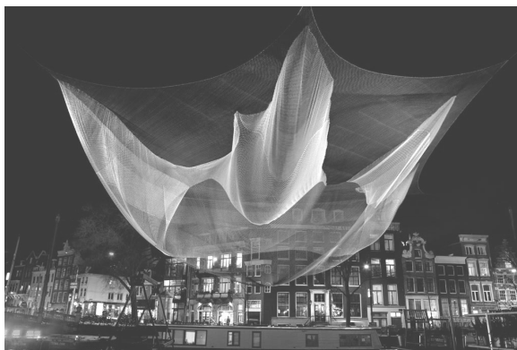
Рис. 4. Дж. Ехелман. 1.26. Шнур. 2011

Не менш цікавими є дизайнерські роботи, де за основу взято мереживні серветки. «...сучасні дизайнери адаптують серветки, акцентуючи менше уваги на самій серветці, використовуючи її форму і контрформу як джерело натхнення, змінюючи її першочергову функцію і переоцінюючи її конструкцію» [3, с. 19]. Використовуючи цю техніку та сучасні епоксидні смоли та інші матеріали, які роблять мереживо міцним, дизайнери створюють сучасні за формою, естетичними якостями ажурні, витончені меблі та інші елементи інтер'єрного та екстер'єрного дизайну.