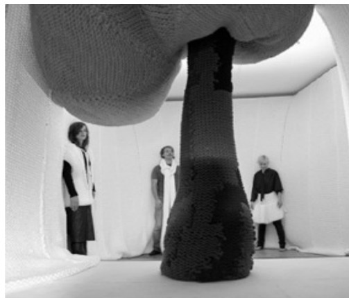
Рис. 2. І. Берглунд. City of Stitches. 2005