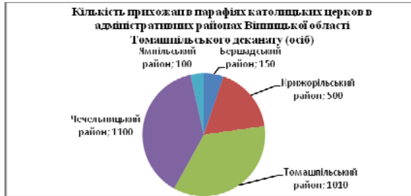
Рис. 3. Кількість прихожан в парафіях католицької церкви в адміністративних районах Вінницької області Томашпільського деканату

Мурафський деканат Кам'янець-Подільської дієцезії – це найчисельніший деканат Вінниччини за кількістю парафіян-католиків. Він об'єднує в собі 34 парафії семи адміністративних районів: Гайсинського, Шаргородського, Тиврівського, Немирівського, Тульчинського, Теплицького, Тростянецького. Кількість прихожан сягає понад п'ятнадцять тисяч. Найчисельнішим католицьким осередком є Шаргородський район. Тут проживає 80 % усіх католиків Мурафського деканату і 30 % католиків Вінниччини (рис. 4).