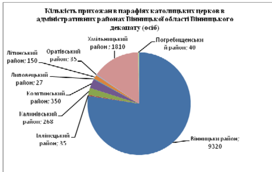
Рис. 2. Кількість прихожан в парафіях католицької церкви в адміністративних районах Вінницької області Вінницького деканату

Вінницький деканат охоплює центральну і північну частини області. Сюди входять Вінницький, Літинський, Хмільницький, Калинівський, Козятинський, Погребищенський, Оратівський, Липовецький, Іллінецький райони. Деканат охоплює 31 парафію, в яких служить 15 священників. Усі парафії разом нараховують 12,1 тис. прихожан-католиків [1]. Католицькі храми тут переважно старовинні і потребують реконструкції. Нові костели побудовані у районних центрах Калинівка, Козятин, у місті Вінниця та прилеглих до нього сел. Деканат за чисельністю католиків посідає 2 місце в області, але лише за рахунок прихожан обласного центру (рис. 2) на яких припадає 77 %.