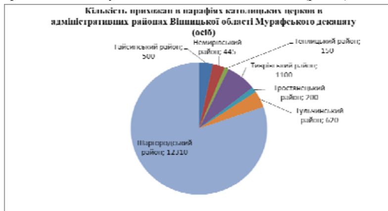
Рис. 4. Кількість прихожан в парафіях католицької церкви в адміністративних районах Вінницької області Мурафського деканату.

Мурафський деканат Кам'янець-Подільської дієцезії – це найчисельніший деканат Вінниччини за кількістю парафіян-католиків. Він об'єднує в собі 34 парафії семи адміністративних районів: Гайсинського, Шаргородського, Тиврівського, Немирівського, Тульчинського, Теплицького, Тростянецького. Кількість прихожан сягає понад п'ятнадцять тисяч. Найчисельнішим католицьким осередком є Шаргородський район. Тут проживає 80 % усіх католиків Мурафського деканату і 30 % католиків Вінниччини (рис. 4).