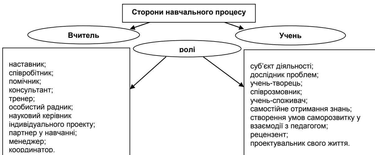
Рис 2. Основні позиції вчителя та учня у системі продуктивного навчання