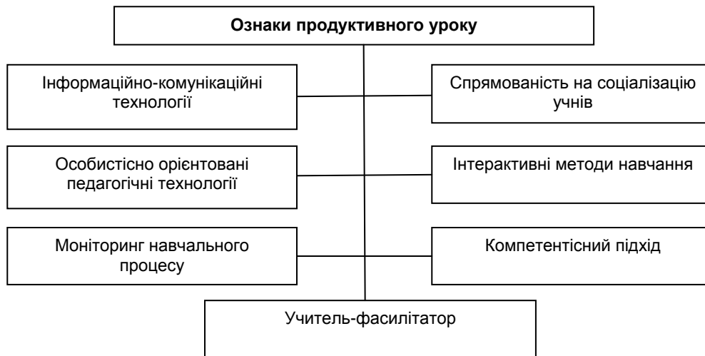
Рис 1. Ознаки продуктивного уроку

Під технологією продуктивного навчання розуміють спробу вийти на новий рівень творчо організованої освіти, заснованої на інтересах учня, який навчається самостійно та взаємодіє з педагогами та психологами лише для консультації [5, с. 103]. Він – конструктор, організатор своїх знань, проектувальник етапів саморозвитку. Головна ж особливість даного підходу до навчання – створення учасниками особистісної освітньої продукції: інтелектуальних відкриттів, винаходів, віршів, задач, гіпотез, правил, досліджень, творів, програм навчання, проєктів. Визначальні ознаки продуктивного уроку представлено у рис.1 [8].