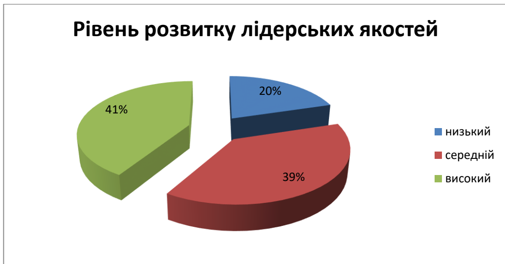
Рис. 2. Кількісні результати дослідження лідерських якостей у підлітків за методикою «Я-лідер» М. І. Рожкова

Аналізуючи отримані результати було визначено, що в 20,3% досліджуваних спостерігається низький рівень розвитку лідерських якостей. У 38,4% досліджуваних виявлено середній рівень, а в 41,3% підлітків спостерігається високий рівень розвитку лідерських якостей, що зумовлено, на нашу думку, прагненням до самоствердження та домінування, бажанням завоювати авторитет у колективі ровесників.