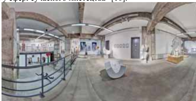
Інтер’єр центру сучасного мистецтва ЄрміловЦентру (Харків, Головний корпус Каразінського університету, майдан Свободи, 6)

У 2012 р. в стінах ХНУ імені В. Каразіна відкрився центр сучасного мистецтва “ЄрміловЦентр”. Окрім меморіалізації пам’яті про видатного художника, Центр має на меті популяризацію сучасного мистецтва й культури, створення поліфункціонального майданчика для демонстрації виставкових проєктів та інновації в просвітницькій і освітній діяльності. “Серед завдань ЄрміловЦентру: активізація соціальної ролі сучасного мистецтва, створення умов для діалогу мистецтва і суспільства, підтримка культурних ініціатив. Центр сприяє розвитку сучасного українського мистецтва, його інтегрування у світовий мистецький контекст, підтримує молодих авторів, є комунікативною платформою для українських і зарубіжних фахівців у сфері сучасного мистецтва” [10].