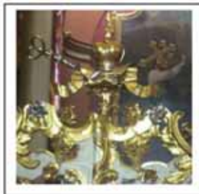
Іл.1. Завершення царських воріт іконостасу, дерево, різьба, позолота, посріблення, собор Св. Юра, м. Львів, 1768р.