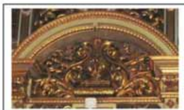
Іл.2. Надбрамне рельєфне зображення на іконостасі, ажурне різьблення, позолота, Івано-Франківський катедральний собор Святого Воскресіння, кінець XIX – початок XX ст.