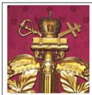
Іл.3. Завершення царських воріт іконостасу, (декоративний елемент), дерево, об'ємно-ажурне різьблення, позолота, собор Святої Покрови, м. Івано-Франківськ, 1994р.