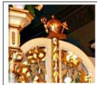
Гл.5. Завершення царських воріт, дерево, різьба, позолота, церква Благовіщення Пресвятої Діви Марії, м. Стрий.