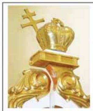
Гл.6. Завершення царських воріт, різьблення, фарбування, позолота, церква Успіня Пресвятої Богородиці, с. Кринос Галицький р-н, Івано-Франківська обл.