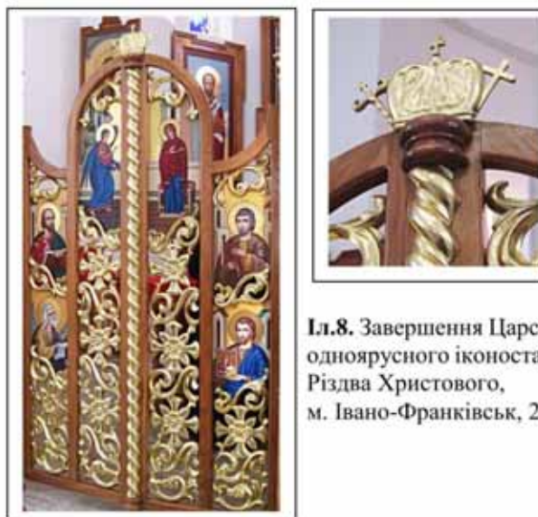
Іл.8. Завершення Царських воріт однопорядкового іконостасу, церква Різдва Христового, м. Івано-Франківськ, 2000р.