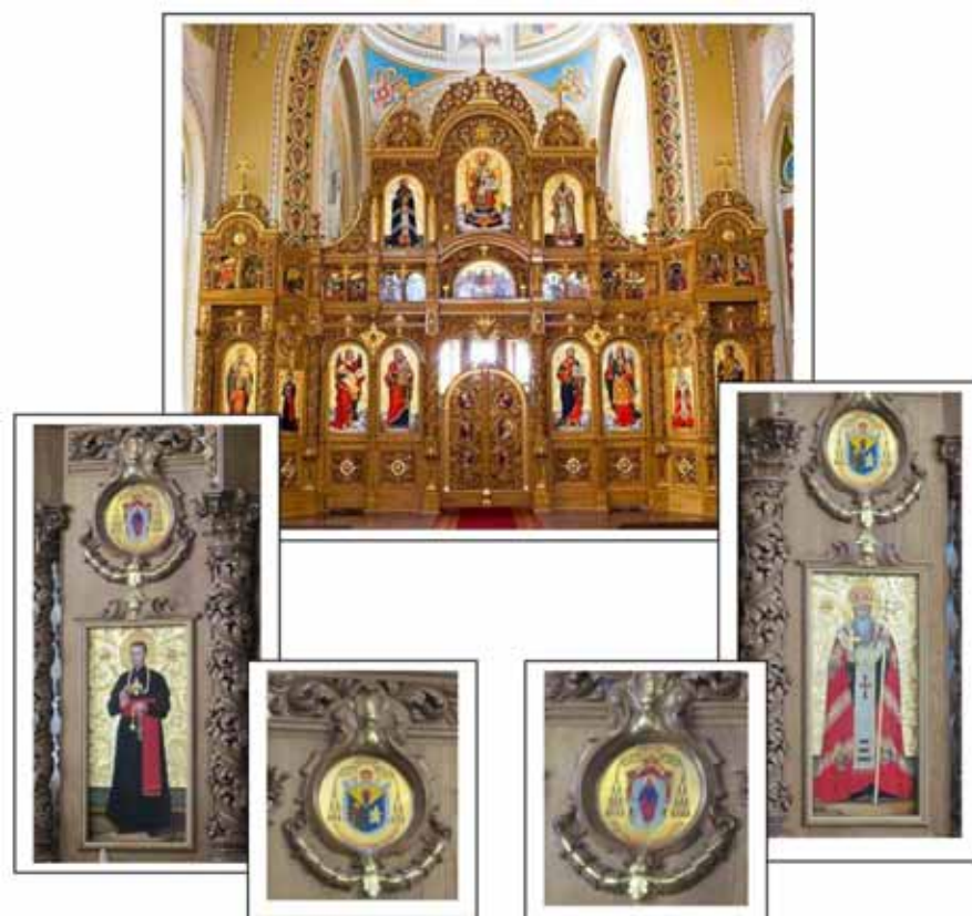
Іл.7. Герби церковних ієрархів на іконостасі церкви Христа Царя оо. Висілян (ЧСВВ), м. Івано-Франківськ, 2006-2007 рр.