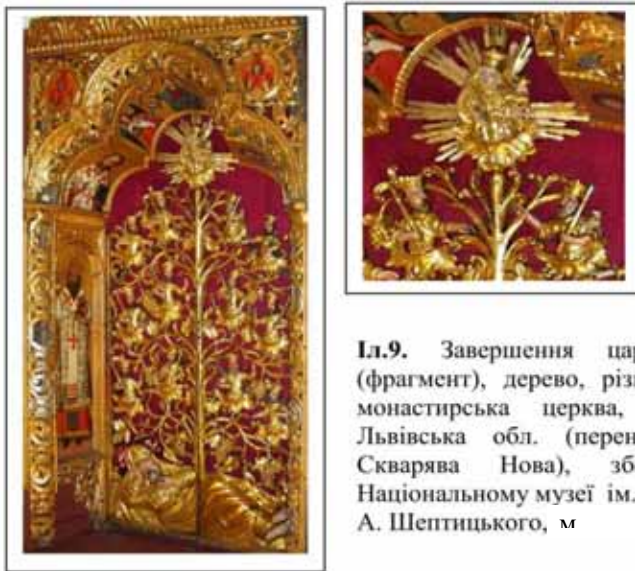
Іл.9. Завершення царських воріт (фрагмент), дерево, різьба, позолота, монастирська церква, с. Жовква, Львівська обл. (перенесений в с. Скварява Нова), зберігається в Національному музеї ім. Митрополита А. Шептицького, м