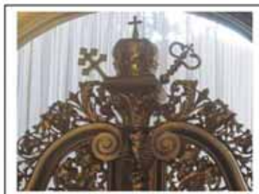
Гл.4. Завершення царських воріт, дерево, різьба, позолота, церква Преображення Господнього, м. Львів, початок ХХ ст.