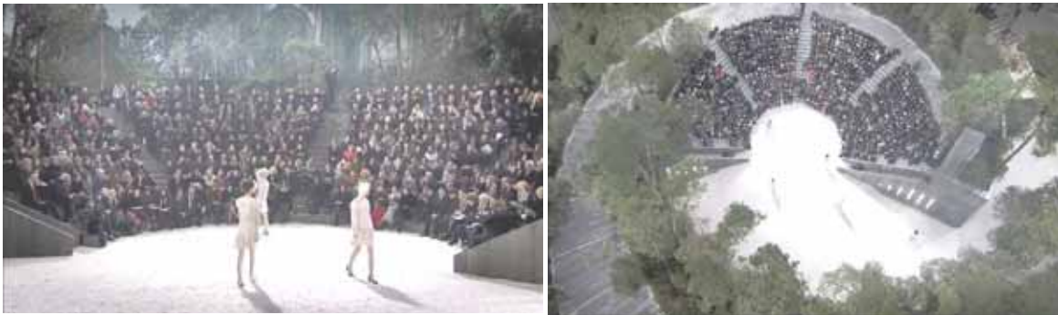
Рис. 1. Організація глядацької та демонстраційної зон у показі колекції “CHANEL” у Grand Palais, Париж, 2013. Дизайнер – Карл Лагерфельд.

впритул до місця показу колекції бренду “Christian Dior” Весна/Літо, 2018. Дизайнер Марія Грація К'юрі для показу колекції вибрала локацію музею Родена в Парижі.