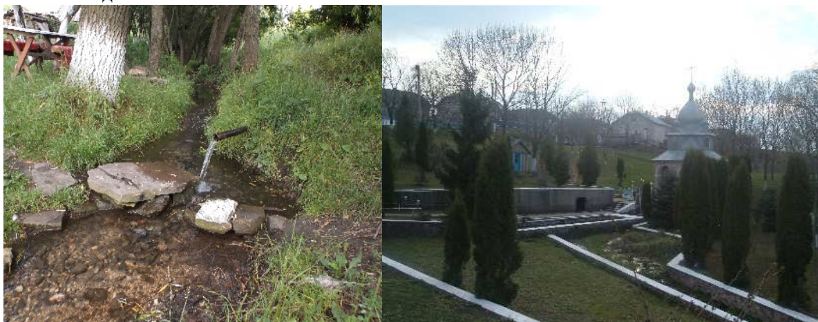
Рис.2. Джерела «Семенів потік» і окультурена «Червона криниця»

Мережа джерел не тільки підживлює річку чистою і прохолодною водою влітку, а й виконують важливу функцію з водозабезпечення місцевих жителів чистою питною водою. Червона Криниця є гідрологічною пам'яткою природи місцевого значення. На джерело «Семенів потік» зроблено подання для його заповідання.