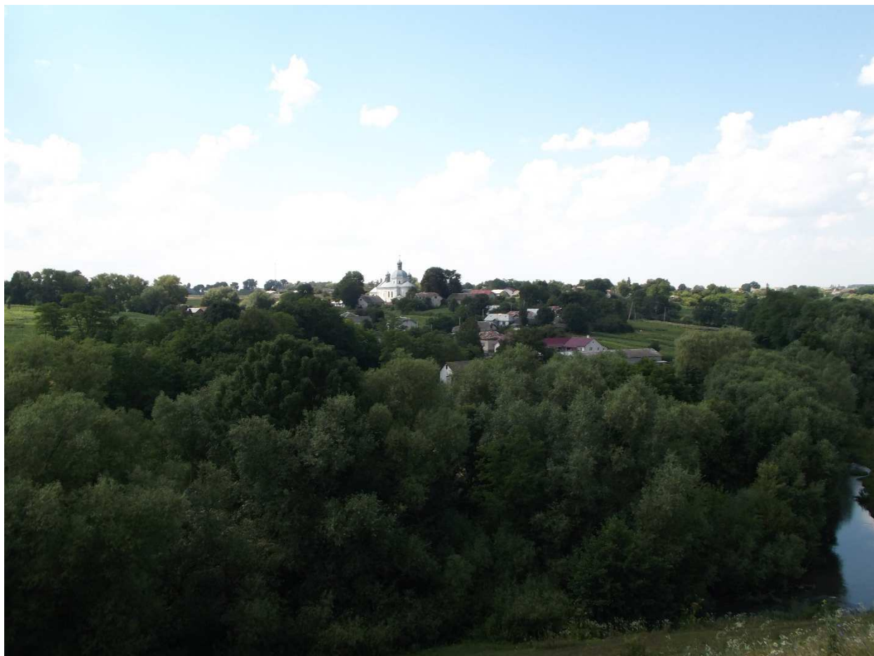
Рис.5. Вид на ландшафт с. Базар з горба Горішнього фільварку

Найбільш зеленим на сьогодні є сільський ландшафт, у якому поєдналися прирусові верби, акації, ясени з великою кількістю дендрологічної флори, висадженої навколо школи, будинку культури, гідрологічної пам'ятки природи «Червона криниця», приватних будинків, посадками горіха грецького та садовими культурами приватних садиб (рис.5).