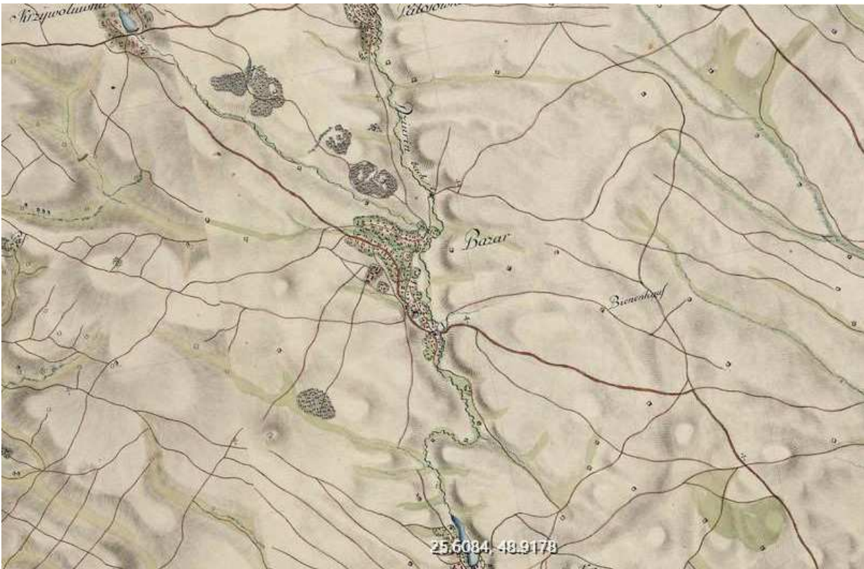
Рис 4. Фрагмент карти першого військового огляду (1764-1784) імперії Габсбургів

Представники тваринного світу представлені ссавцями: кабаном, лисицею, зайцем, тхором, куницею, ласкою, їжаком. Найчисельнішими видами представлені птахи: лелека білий, чапля сіра, пугач, ворона чорна, сорока, грак, крук, підорлик малий, сойка, дятел звичайний, горлиця садова, жайворонок польовий, зозуля, соловейко західний, синиця блакитна, кропив'янка садова, вівсянка городня, горихвістка звичайна, горобець хатній, ластівка сільська, одуд, шпак звичайний, курочка водяна, перепілка, яструб малий та інші.