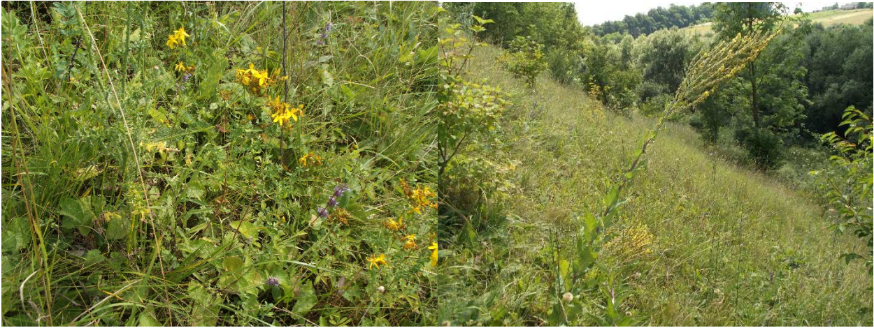
Рис.3. Різнотравно-чагарникові угруповання рослин на схилових місцевостях річкової долини