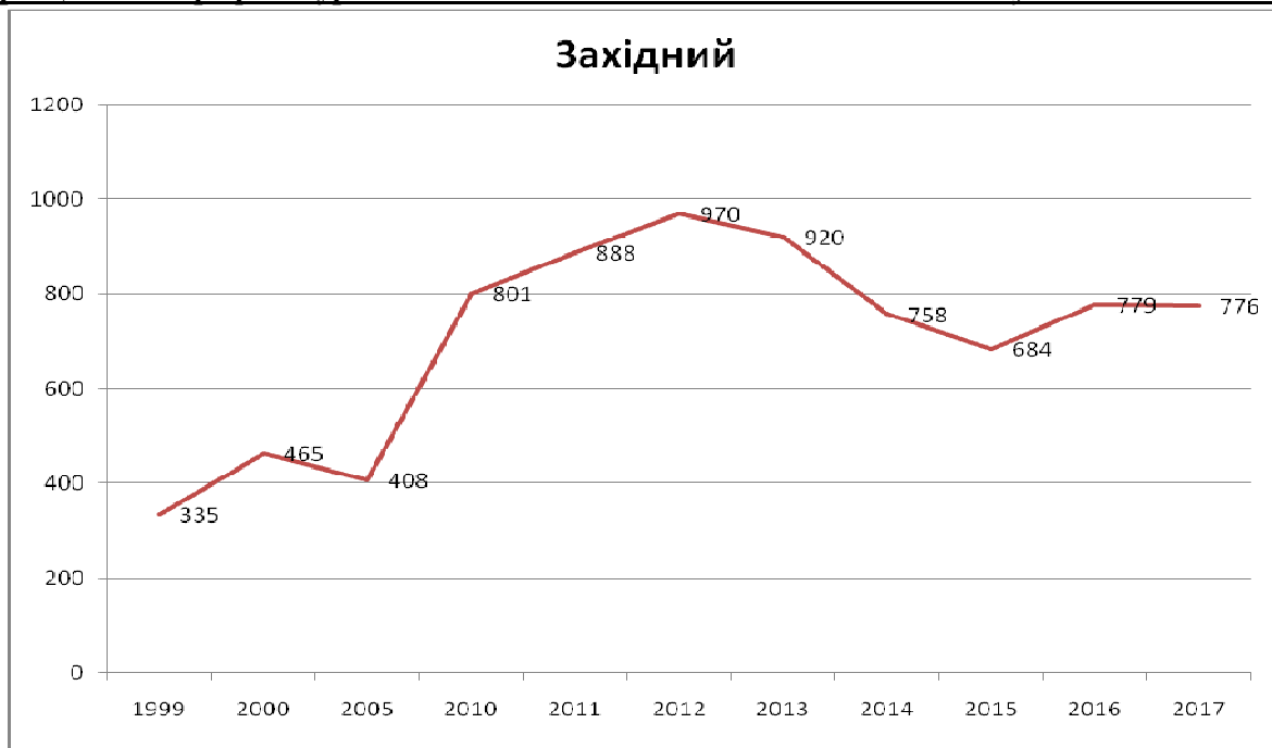
Рис. 1. Кількість суб'єктів туристичної діяльності, що надавали послуги у Західноукраїнському регіоні (одиниць) за 1999-2017 рр. [9,10]