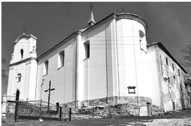
Рис.5. Костели: 1 – у с.Струсів; 2 – у с. Залав'є.