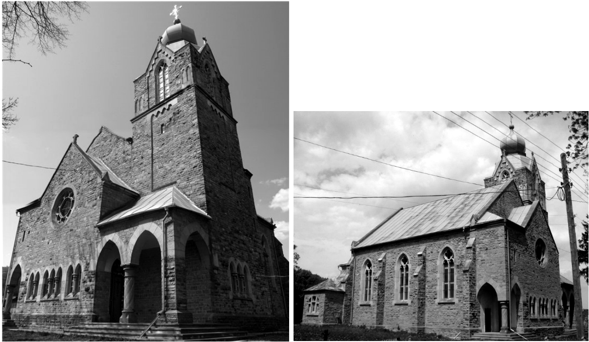
Рис.3. Костел в с.Підгайчики.