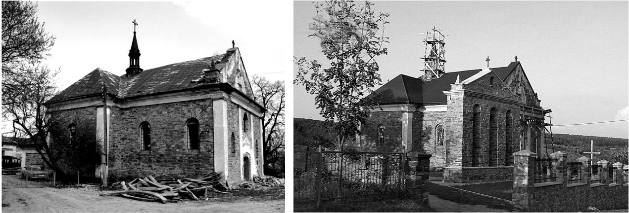
Рис.2. Костел в с. Острівець до і під час реставрації

збудували плебанію 1 , яка у період військових дій була знищена. З 1949 до 1993 рр. у костелі облаштували склад. Вже тоді йшли розмови про передачу храму греко-католикам, але в тих на той час просто не вистачало коштів на ремонт. У серпні 2012 року занедбаний костел передали місцевій греко-католицькій громаді, відтоді розпочалася його реставрація (рис.2) [9]. Зовні храм не змінився, всередині – встановлено іконостас.