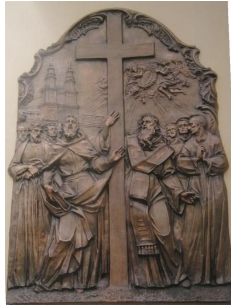
Пам'ятна стела на честь приходу отців ордену Василіан. 2010.

Серед найважливіших робіт – відновлення колони Пресвятої Богородиці та статуї Яна Непомука у Бучачі [26, с. 188]. Цікаві роботи – створення 2006 р. копії скульптури «Святий Онуфрій», котру свого часу створив видатний митець доби рококо Іван Георгій Пінзель. Копія передана до Львівської національної галереї мистецтв через малу доступність оригіналу для дослідників і прихильників мистецтв [43, с. 478]. Це не перше звернення Романа Вільгушинського до творчості ушавленого попередника середини XVIII століття – І. Пінзеля. Скульптор, після детального студіювання авторського почерку Іоана Георга Пінзеля, працює над реконструкцією 7-ми алегоричних скульптур, що