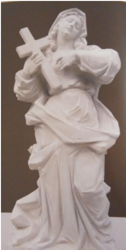
Свята Текля. 2011.

прикрашають дах ратуші в місті Бучач. Серед нових робіт: Давид вбиває Голіафа; Козак та Невільник (сидячі фігури у геральдичній композиції); Самсон розриває пащу лева; Геракл вбиває гідру елегейську; Зевс метає блискавки та алегорична фігура Достатку. Частина з них знищена чи значно пошкоджена пожежею. Скульптор намагається реставрувати пошкоджені твори, що надасть можливість зберігати оригінали в музеї, а копії виставити на первісні місця.