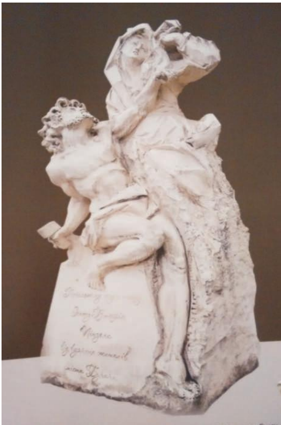
Пам'ятник І. Пінзелю. 2014. Вапняк.