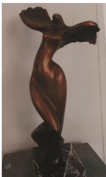
Танцююча. 2010. Бронза, мармур.