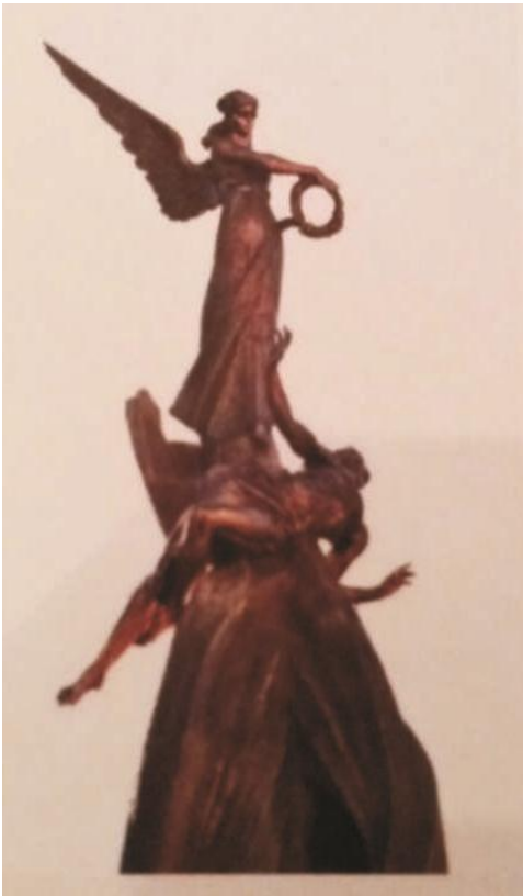
Пам'ятник Небесній маті. м. Тернопіль. 2016.

У 1994 році Роман Вільгушинський вступає до Національної спілки художників України. Сьогодні митець – відомий скульптор, автор численних монументальних творів, що гармонійно вписуються у просторове середовище різних куточків України [28, с. 165]. Його творчий доробок представлений цілою галереєю видатних постатей української історії та національної культури: погруддя