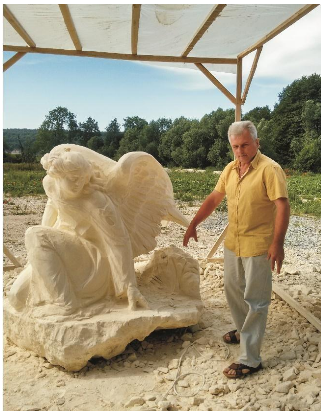
Ангел. 2016. Пісковик.

Указом Президента України від 1 грудня 2009 року № 999/2009 «Про відзначення державними нагородами України працівників підприємств, установ та організацій Тернопільської області» Роману Вільгушинському присвоєно почесне звання – Заслужений художник України.