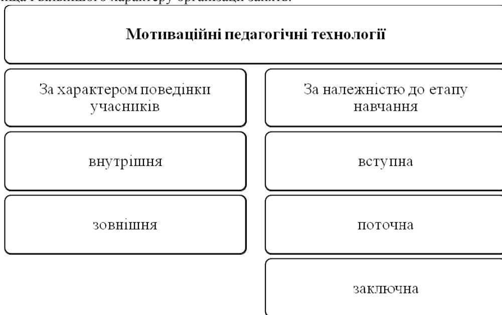
Рис. 1. Класифікація навчальної мотивації.

Проте найбільш цікавими, на нашу думку, є дослідження О. Юпітова і А. Зотова [17], щодо ситуації професійного самовизначення студентів. Враховуючи дані цих авторів, зазначимо, що студенти I-II курсів відчувають тривогу стосовно нового незвичного середовища і вільнішого характеру організації занять.