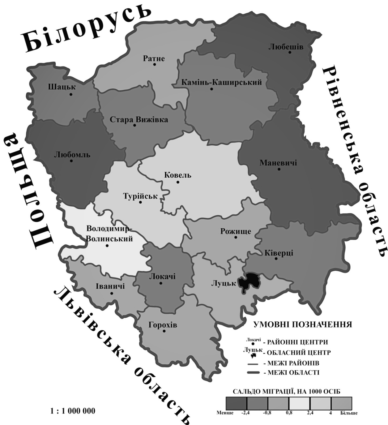
Рис. 3. Картосхема міграційних рухів населення у межах Волинської області у 2017 р.

структурі мігрантів не має значного впливу на процеси укладання шлюбу та інтенсивність відтворення населення у межах області, адже для третинного співвідношення статей характерне переважання жіночого населення над чоловічим [2, с. 405].