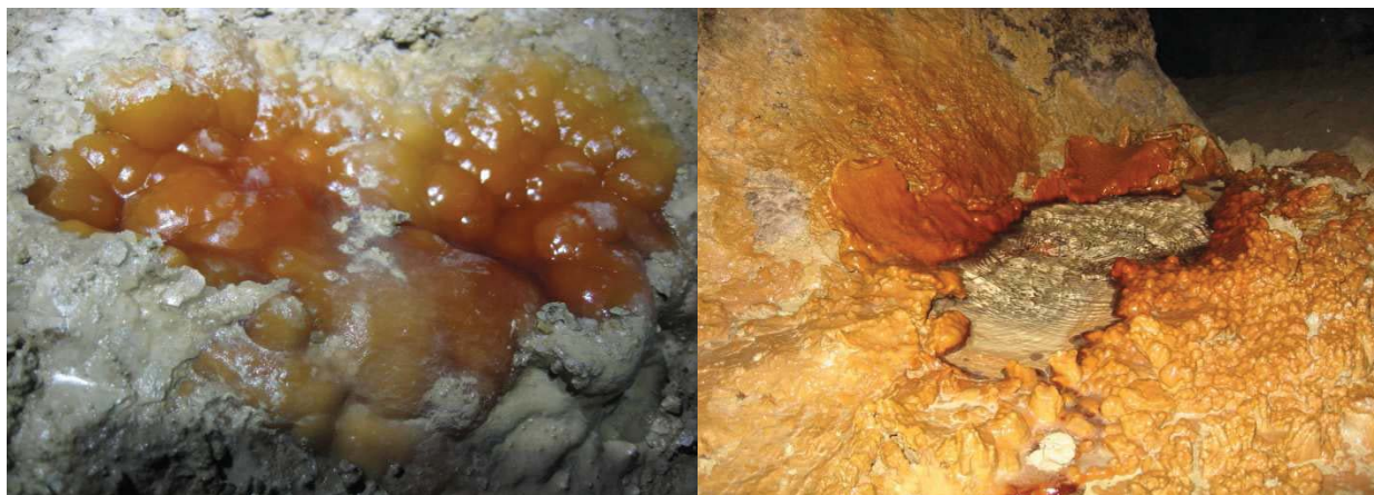
Рис. 2. Натічні форми в печерах.

Природа «оздоблює» свої підземні палаци. Разом із дощовими і талими водами, що проникають у печери крізь прошарки вапняків, під землю заносяться карбонатні сполуки, які протягом багатьох сотень і тисяч років утворюють різноманітні натічні форми: сталактити, сталагміти, драпіровки, колони (Рис. 2).