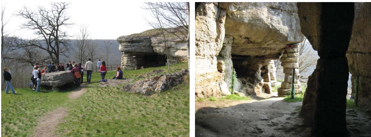
Рис. 4. Давньослов'янський храм в с.Монастирок

В селі Монастирок, розташованому над мальовничим каньйоном річки Серет, знаходиться те, що примушує швидше битись серце – давньослов'янський храм «Язичницька святиня» IX століття поруч з старенькою церквою (XVIII ст.). Він використовувався не тільки ранніми християнами, а ще