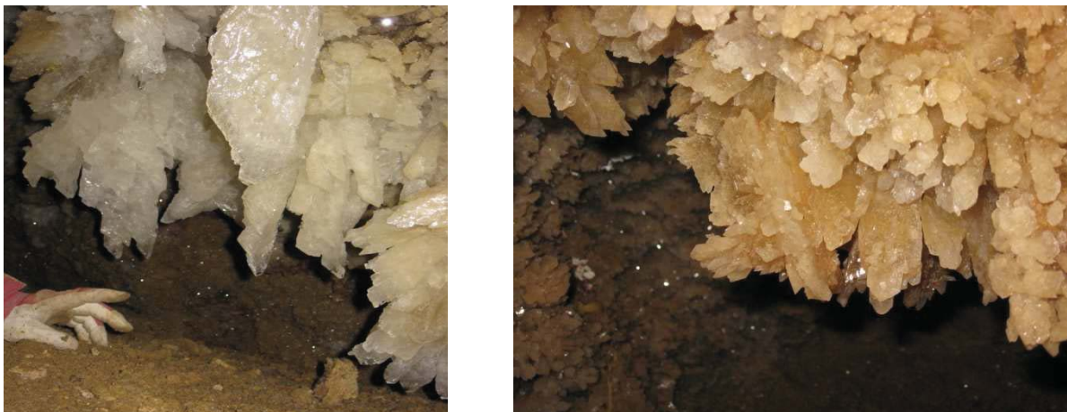
Рис. 3. Кристали гіпсу в Подільських печерах

В селі Монастирок, розташованому над мальовничим каньйоном річки Серет, знаходиться те, що примушує швидше битись серце – давньослов'янський храм «Язичницька святиня» IX століття поруч з старенькою церквою (XVIII ст.). Він використовувався не тільки ранніми християнами, а ще