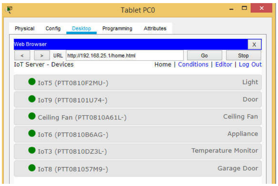
Рис. 5. Контроль елементів

Отже, засоби Cisco Packet Tracer дозволяють створити єдину систему розумного будинку, що дозволяє наочно вивчати роботу усіх її компонентів, виконувати їх налаштування, що має практичне значення не лише в процесі монтажу системи, але і для навчання студентів створення робочих макетів для дослідження, налаштування та монтажу мережі «розумний будинок».