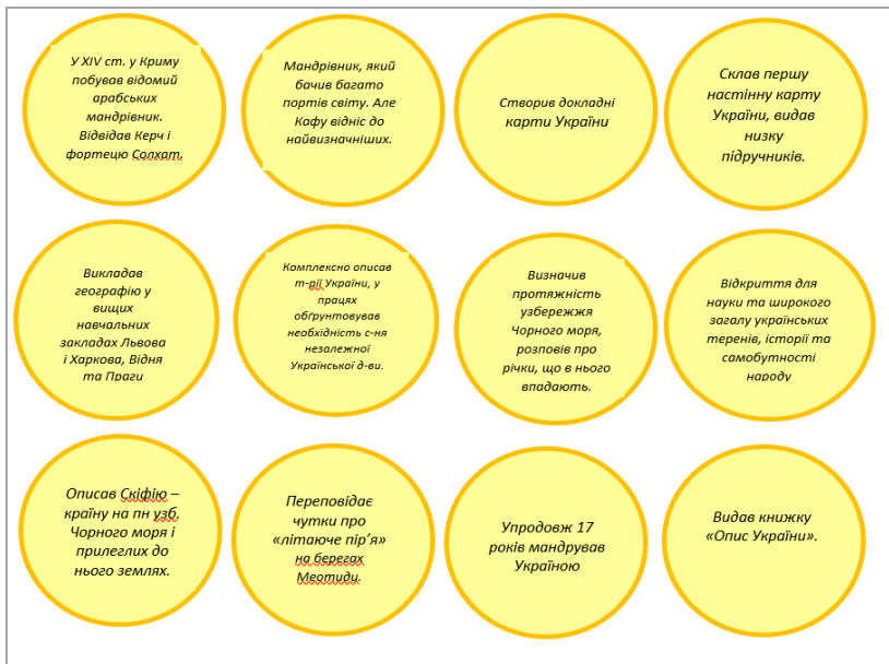
Рис. 2. Шаблон медалей для гри

Кожна гра корисна для інтелектуального розвитку учнів та виховання їх особистих якостей. У грі обов'язково мусять бути захоплюючі завдання, виконання яких потребує розумового зусилля, подолання деяких труднощів.