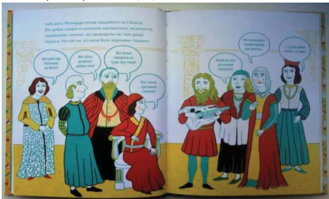
Іл. 2. Розворот книги Ізабель Томас. Маленька історія Великих Людей. Леонардо да Вінчі. Ілюстратор – Катерина Спітцер. С.24-25.

У книзі 63 сторінки, кожна з яких проілюстрована. Співвідношення тексту та ілюстрацій становить 30/70, де 30 % займає текст, а 70 % – ілюстрації. Графічне зображення насичене яскравими контрастними кольорами, де переважає лінійна графіка. Особлива, продумана незвична архітектоніка розворотів книжки, в якій багато «повітря», простору для гри уяви, допомагає маленькому читачеві сконцентруватися на основному. Також присутні максимально заповнені сторінки із зображеними посталями людей, предметів. Ілюстраторка використала хмаринки над головами персонажів, що виглядає як розмова героїв між собою (іл. 2).