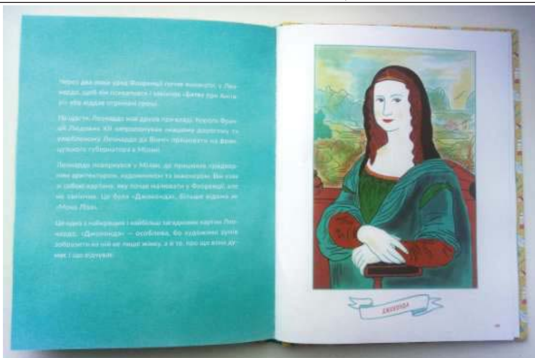
Іл. 4. Розворот книги Ізабель Томас. Маленька історія Великих Людей. Леонардо да Вінчі. С.48-49.

Отже, спостерігаємо щораз активніше залучення комп'ютерної графіки в оформлення української дитячої книги. Крім того, значного поширення тут набуває мінімалістична манера виконання образів та сюжетів, яка передбачає використання локальних кольорів, повторення елементів, наявність кольорових акцентів. Це, у свою чергу, наближає її до трактування графіки, властивій коміксам. На прикладі видання «Маленька історія Великих людей. Леонардо да Вінчі» спостерігаємо як сміливо тут демонструється авторський рисунок, індивідуальність граничної стилізації дійових персонажів, яскраве кольорове вирішення, перехід зображення в майже орнаментальне й декоративне заповнення площини аркуша (особливо на обкладинці), оригінальна графічна презентація тексту. Таким чином, дитяча ілюстрація починає «говорити» дорослою фаховою візуальною мовою.