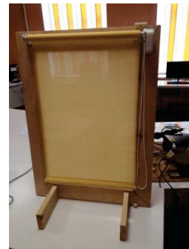
Рис. 2. Макет вікна зі шторою

Переконані, що чим більше студенти займаються практичною роботою, тим більше розкривають власні здібності та проявляють зацікавленість до технічних дисциплін. Працюючи над реальними проєктами, вони виробляють навички, які визначають компетентного фахівця, а їх реалізація сприяє формуванню фахових компетентностей і дозволяє пройти весь технологічний алгоритм від виявлення проблеми, зародження ідеї до створення самого продукту, який в майбутньому може стати ідеєю для заснування стартапу.