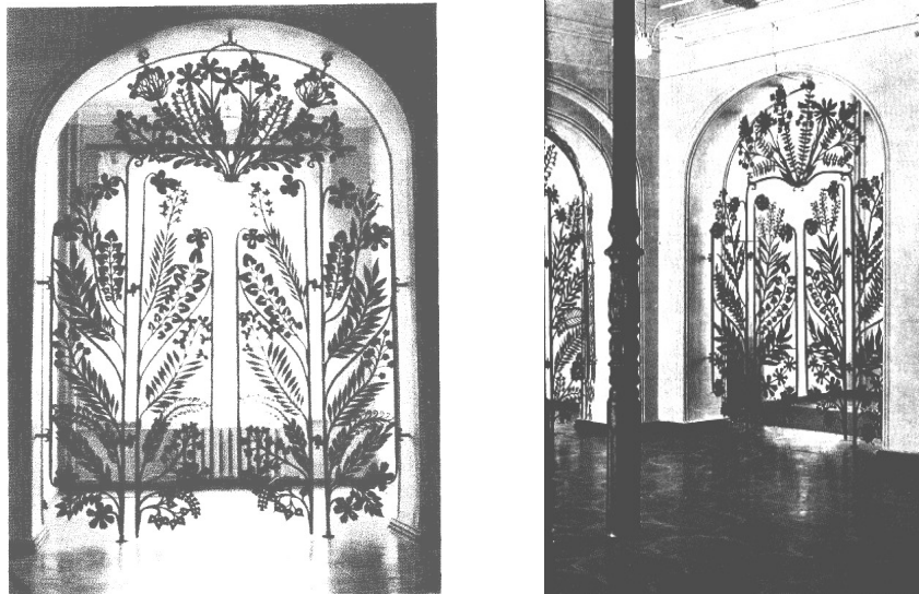
Рис. 2. Декоративна перегородка-двері у фойє філармонії в Києві. Метал, ковка. Художник А. Миловзоров.

рух кожної гілки, кожної квітки. Завершення композиції демонструвало розпущений привабливий кущ, що через статичність вирішення рисунка виступав самостійним елементом у загальній композиції перегородки. Оригінальності твору добавляла різноманітна фактура обробки металу, що у кожному окремому випадку підкорялася формі листків та квітів. Ця перегородка-двері виділялася багатою художньою майстерністю виконання та виражала авторську любов до природи [2, с. 175].