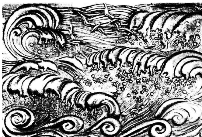
Рис. 1. Панно «Хвиля» у магазині «Океан», м. Київ, худ. А. Домнич

Інколи на площині стіни розміщувалися 3–5 панно, а подекуди вони займали всю площину стіни, наприклад, у магазині «Океан» в м. Києві. Тут інтерес викликали яскраві декоративні вставки в оформленні інтер'єру приміщення. Це цікаві вітражі і панно «Хвиля» (рис. 1), які виконав у техніці чеканки художник А. Домнич [2, с. 159].