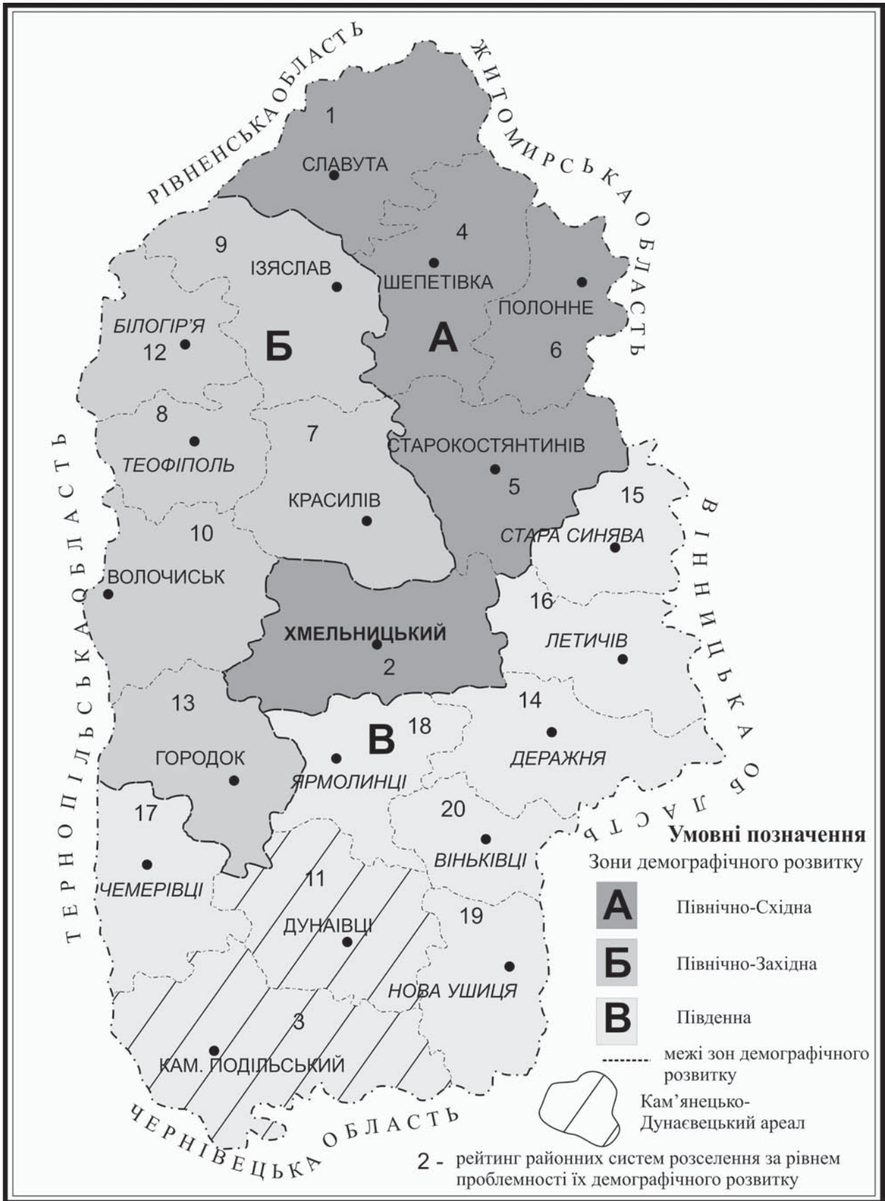
Рис. 2. Зони демографічного розвитку Хмельницької субрегіональної системи розселення