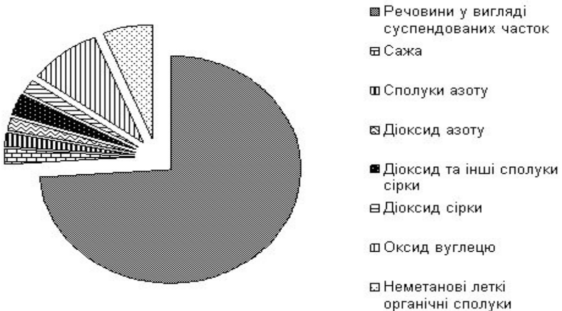
Рис. 3. Сумарні обсяги викидів забруднюючих речовин та груп речовин в атмосферне повітря дробарно-сортувального цеху

пилоутворення, вони утворюють пласт “над-кар'єрного повітря” з стабільно високим вмістом у пилі різних фракцій. У кар'єрі на частку доріг припадає 70-90% всього пилу, що викидається в повітря. Інтенсивність пиловиділення доріг при використанні автотранспорту у басейні кар'єру складає 7000 мг/с, а на один самоскид припадає більше 10 кг зметеного пилу за добу. Значне пиловиділення присутнє при розвантаженні самоскидів та думпкарів, транспортуванні гірничої маси конвеєрами, подрібненні її у дробарних установках. При роботі бульдозерів на відвалах виділяється 1500-2500 мг/с, а при роботі каменерізальних машин кар'єру - 140-1200 мг/с пилу [4].