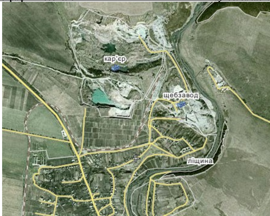
Рис. 1. Територія промислового підприємства ТзОВ “Бурдяківський спецкар’єр”(вид з космосу)