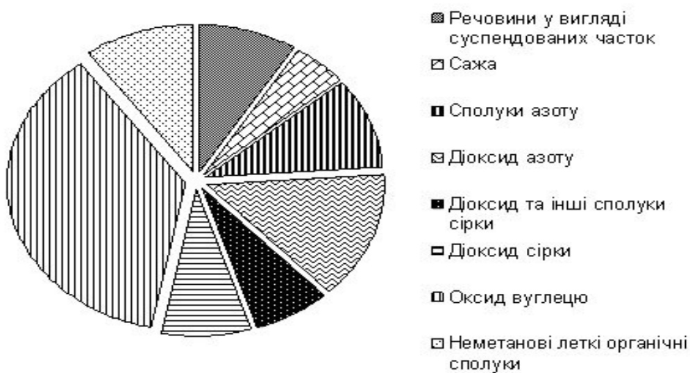
Рис. 2. Сумарні обсяги викидів забруднюючих речовин та груп речовин в атмосферне повітря кар’єру