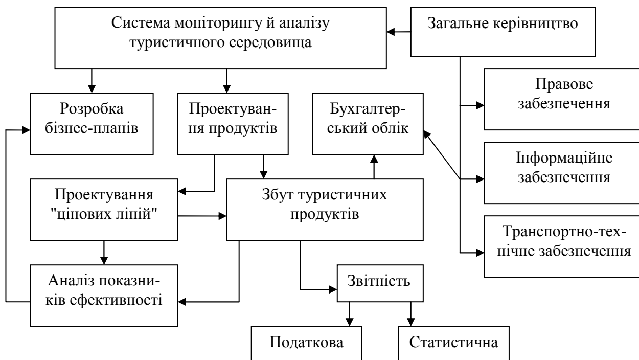
Рис. 3. Структурна схема менеджменту туристичної організації

Друга група важливих заходів організації системи туризму – стосується формування сприятливого інформаційного середовища щодо українських туристичних ресурсів. Це, зокрема, мають бути інформаційні повідомлення, реклама, інші елементи інфраструктури на перетині питань туристичної привабливості та повідомлень про неї.