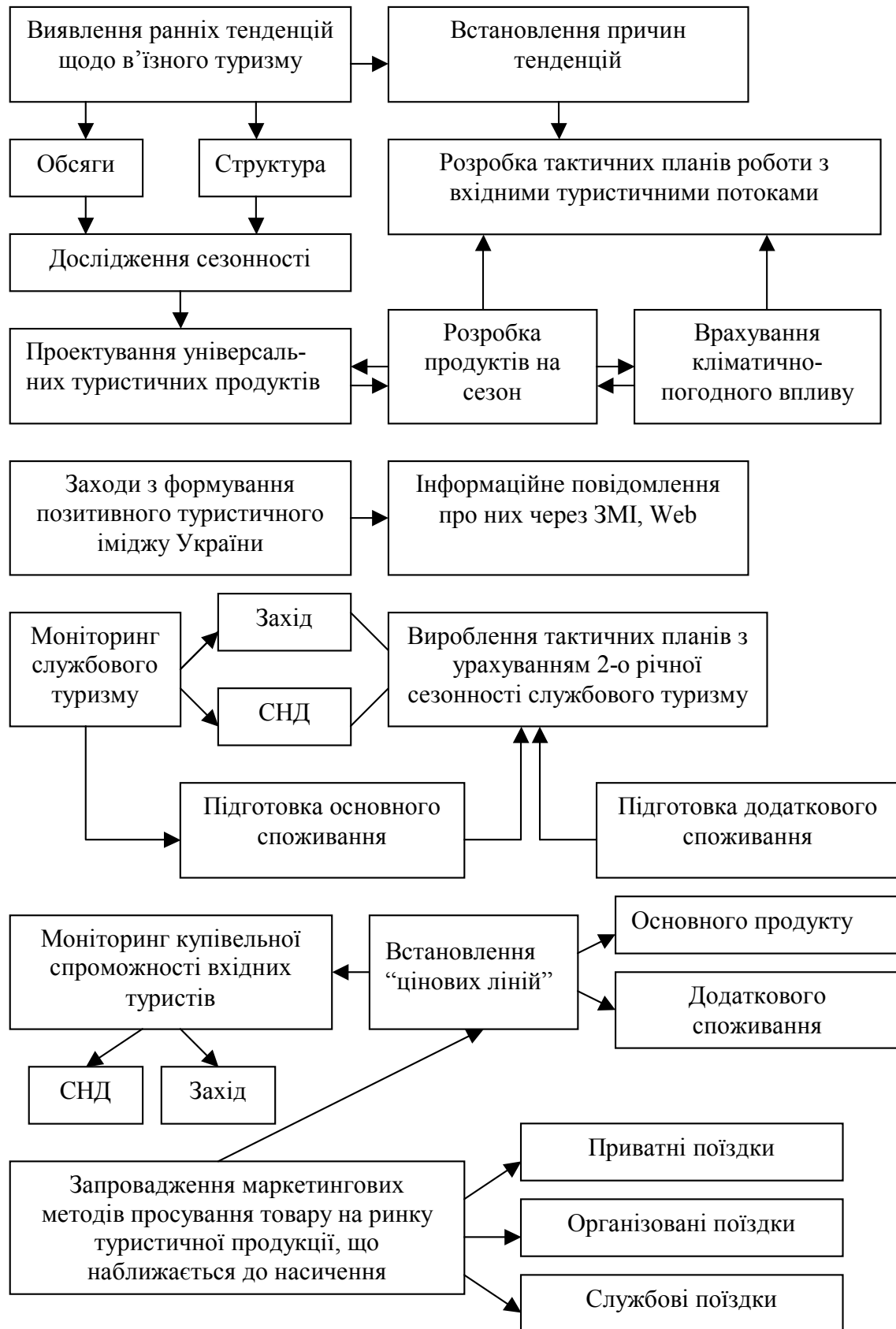
Рис. 2. Схема функціонально-операційної підсистеми адаптивного менеджменту туристичної організації (початок)