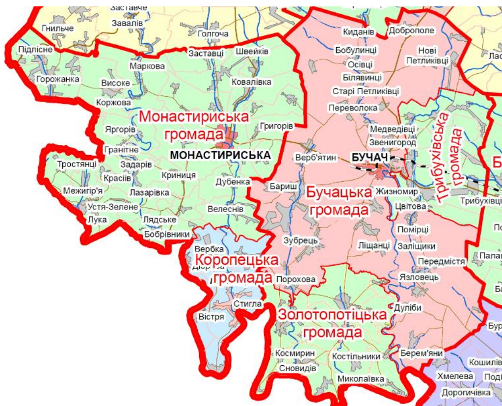
Рис. 1. Сформовані ОТГ на базі Бучацького та Монастириського районів

Після Другої світової війни значних змін зазнала мережа населених пунктів, а також склад населення (рис. 2).