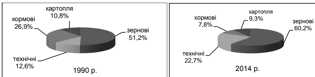
Рис. 2.3. Структура посівних площ у Тернопільській області, %

Але, водночас, ті господарства (а це переважно сільськогосподарські господарства), що займаються вирощуванням цукрових буряків, значно підвищили врожайність цієї культури (з 2000 до 2014 рр. у 2 рази) внаслідок використання передових технологій, в т.ч. й іноземних. У господарствах населення посівні площі і валові збори цукрових буряків різко зменшилися через неефективність виробництва (великі затрати на вирощування і транспортування буряків, трудомісткість виробництва). Найбільше цукрових буряків збирають у Кременецькому, Підволочиському, Козівському, Буцацькому районах, найменше – у Бережанському, Борщівському, Лановецькому районах. Це відображається на сировинній базі цукрових заводів, яка значно звузилась, а відповідно й виробництво цукру поступово зменшується.