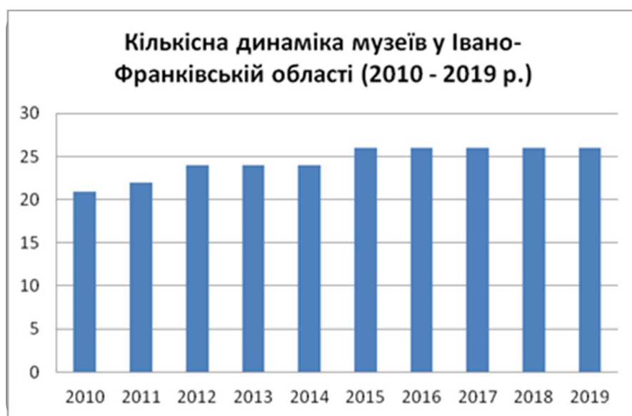
Рис.1 Кількість музейних установ в Івано-Франківській області з 2010 по 2019 рр.

За своїм профілем музеї поділяються на такі види: історичні, археологічні, краєзнавчі, природничі, літературні, мистецькі, етнографічні, технічні, галузеві тощо. На основі ансамблів, комплексів пам'яток та окремих пам'яток природи, історії, культури та територій, що становлять особливу історичну, наукову і культурну цінність, можуть створюватись історико-культурні заповідники, музеї-заповідники, музеї просто неба, меморіальні музеї, садиби. У структурі музеїв за видами переважають історичні музеї – 11, комплексні – 6, мистецьких музеїв – 4, літературних та художніх – по 2 музеї, а також 1 галузевий (рис.2) [9]. Більшість громадських музеїв є або краєзнавчими, або етнографічними, іноді це родинні історичні музеї тощо.