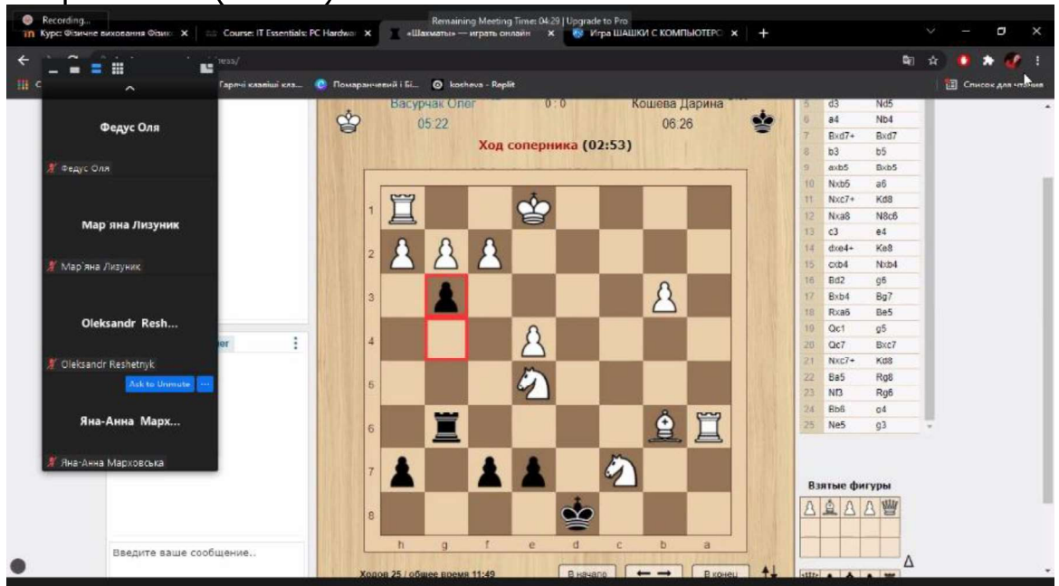
Рис. 1. Вигляд з екрану онлайн платформи для гри в шахи

Щоб зіграти партію, досить зробити у відповідній вкладці «Знайти суперника», «Запросити на гру» або інший варіант — почекати поки суперник запросить на гру і «прийняти» його запрошення (Рис.1.)