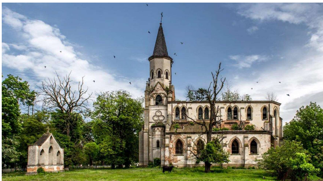
Рис. 2. Костел у с. Сороцьке