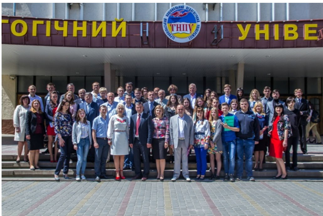
«Європа–Україна–Тернопільщина: міжнародні відносини, співпраця, безпека» (Міжнародна наукова конференція на історичному факультеті ТНПУ ім. В. Гнатюка, присвячена Дню Європи в Україні (19–20 травня 2017 р.)