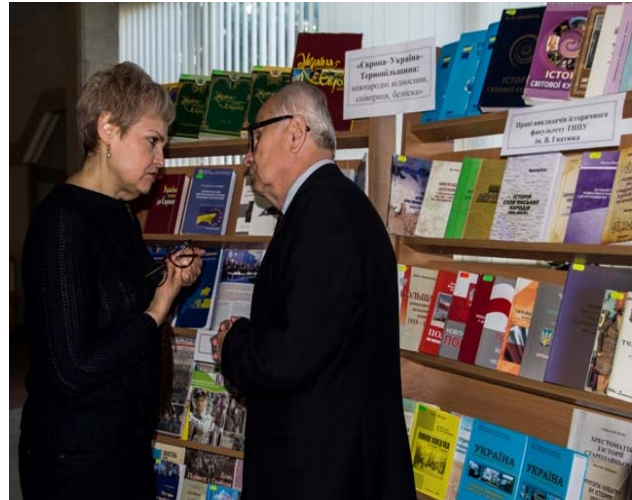
«Європа–Україна–Тернопільщина: міжнародні відносини, співпраця, безпека» (Розгорнута виставка наукової літератури із зазначеної проблематики під час роботи конференції у фойє головного корпусу ТНПУ ім. В. Гнатюка)