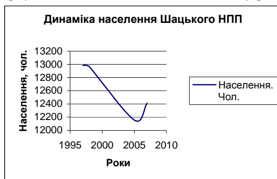
Рис. 1. Динаміка населення Шацького НПП.

Для дослідження динаміки населення, нами було обрано території чотирьох рад, які повністю знаходяться у парку. Дані щодо кількості населення у різні роки подано у рис. 1.