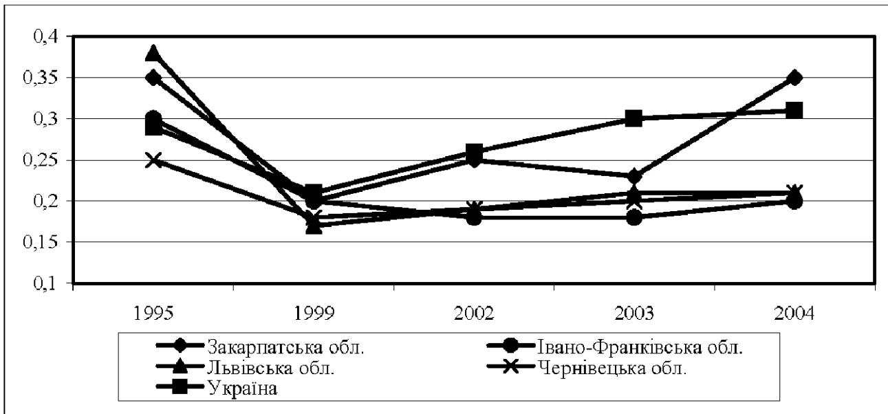
Рис. 3. Динаміка коефіцієнту використання місткості підприємств готельного господарства Карпатського регіону, 1995-2004 роки

Доходи від експлуатації готелів та інших місць для короткотермінового проживання у 2004 р. становили 874 829,3 тис.грн, з них лише 8 % одержано готелями Карпатського регіону, причому частка Львівської області із загальних доходів в Україні складає 5%, а на всі інші карпатські області сукупно припадає менше 3% загальнонаціонального доходу від надання готельних послуг. Слід наголосити, що у всіх областях України у 2004 р. доходи від надання послуг щодо проживання у готелях зросли насамперед за рахунок підвищення цін і тарифів на готельні послуги (а не за рахунок покращення якості сервісу чи зростанні попиту на нічліжні послуги).