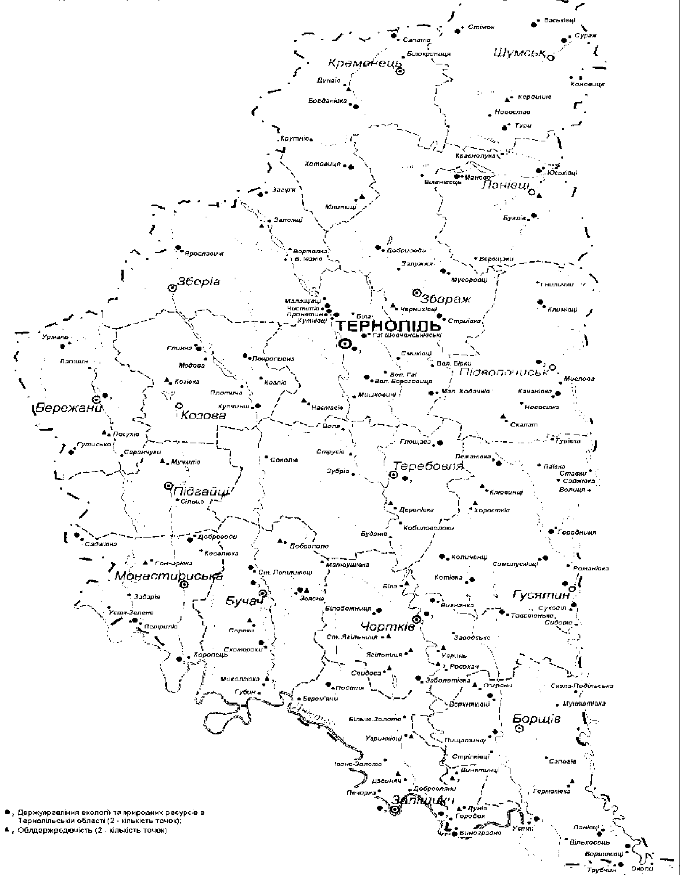
Рис. 2. Земельно-грунтовий моніторинг Тернопільської області.

Розміщення об'єктів земельно-грунтового моніторингу Тернопільської області показано на рисунку 2.