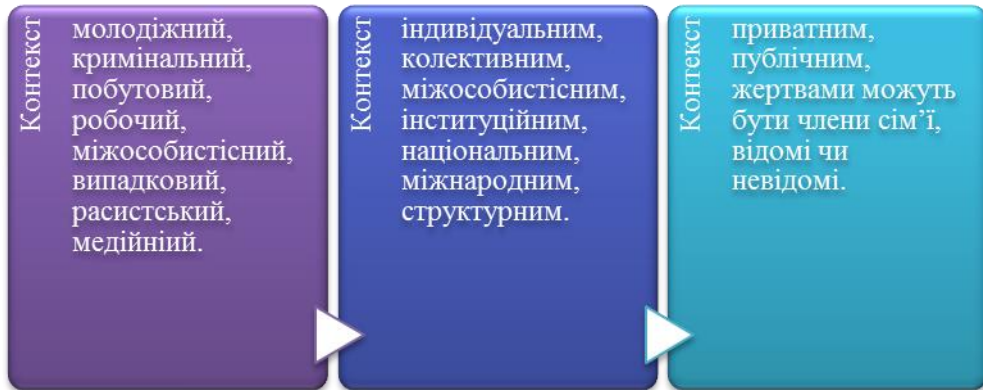
Таблиця 2: Різновиди насильства.