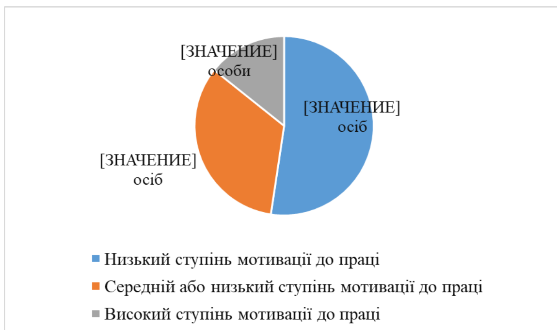
Рисунок 2. Результати повторної діагностики

З даних діаграм можна побачити, що кількість безробітних з низьким рівнем мотивації зросла на 7 осіб (33,3%). Також виявилось, що у 4 (19%) безробітних, які мали високий рівень мотивації до праці, перебуваючи на обліку в Центрі зайнятості, знизився рівень мотивації до праці. Тобто за час перебування на обліку у безробітних знижувався рівень мотивації до праці, а це свідчить про те, що безробітним не вистачає послуг, які були б спрямовані на підвищення рівня мотивації до праці.