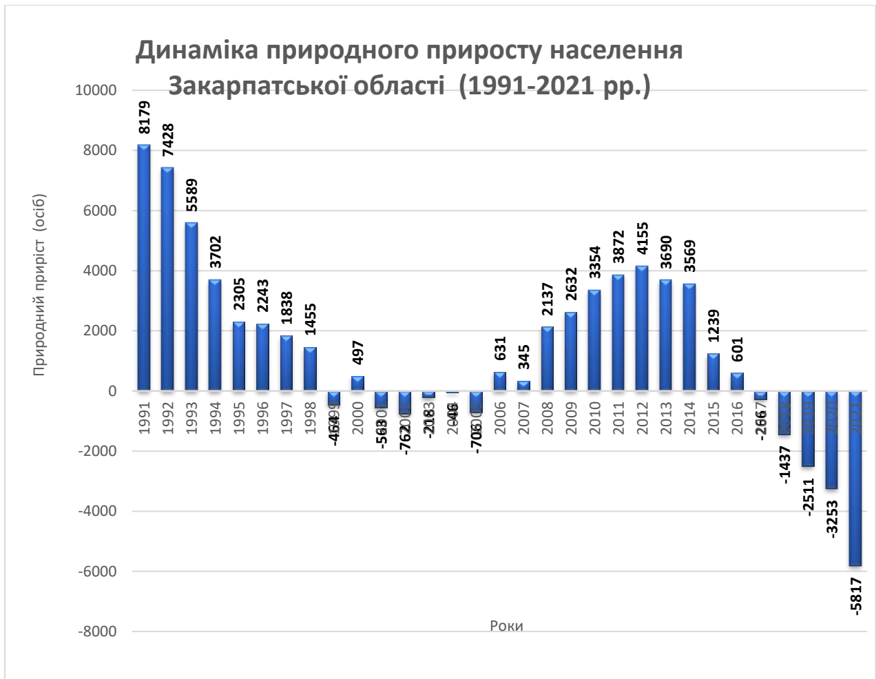
Рис. 2. Динаміка природного приросту населення Закарпатської області за 1991-2021 рр. (побудовано за даними [1, 2, 3, 4]).

трудоу ресурсів, що в майбутньому посилить процеси “старіння нації” в області, зменшення народжуваності і відповідно скорочення населення. Катастрофою для населення Закарпатської області може виявитися виїзд закордон цілих сімей в останній 2022 рік.