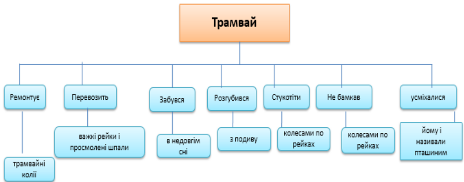
Денотатний граф до казки Ю. Яриши «Трамвай і Щиглик»

Приклад. Під час вивчення авторської казки Ю. Яриши «Трамвай і Щиглик» (3 клас) для характеристики головних персонажів учні читають і запам'ятовують сюжет твору. Потім з допомогою вчителя вони складають блок-схему з центральним словом іменником (персонаж казки), від якого ідуть розгалужені блоки-дієслова (дії персонажа). Своєю чергою від них відходять інші розгалуження з додатковими характеристиками персонажа. За допомогою цього прийому у школярів розвивається здатність до аналізу художнього твору, виокремлення головних відомостей, вміння узагальнювати інформацію, усвідомлювати зв'язки між різними поняттями тощо.