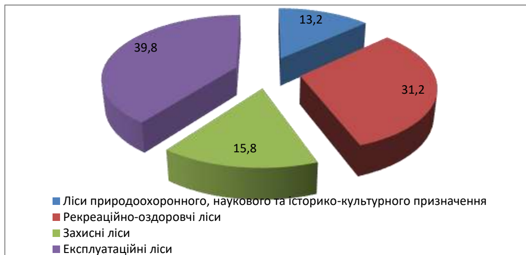
Рис. 2 – Категорії лісів у Берегівському лісгоспі (%) [20, 21, 23]