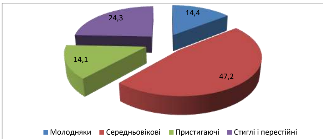
Рис. 5 – Вікова структура лісів ДП «Берегівський лісгосп» (побудовано за [20,21])