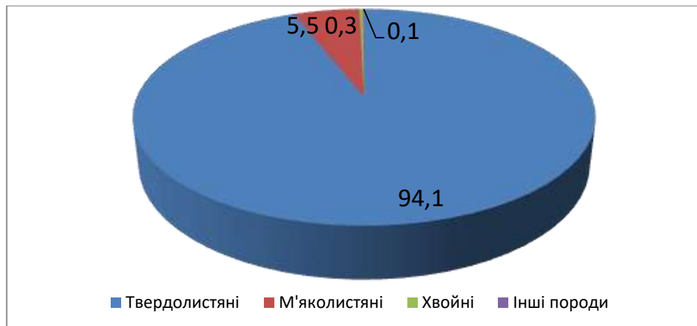
Рис. 4 – Склад порід в лісах Берегівського лісгоспу (%) (побудовано за[20, 21])