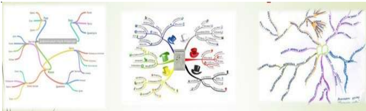
Рис. 2. «Зразки ментальних карт»

У досвіді роботи педагога Г. Крайньої [3] описано поради відомого британського психолога Тоні Бьюзена щодо техніки створення ментальних карт. Так, практикам наголошують: