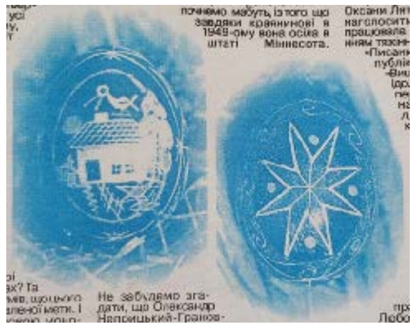
Рис. 1. Ілюстрація до публікації Фарина І. Розповідають писанки про долі. Діалог . 2010. 2 квіт. С. 8