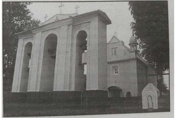
Рис. 1. Ілюстрація до публікації Сушко М. Наша святиниця. Воля . 2015. 10 лип. С. 3.