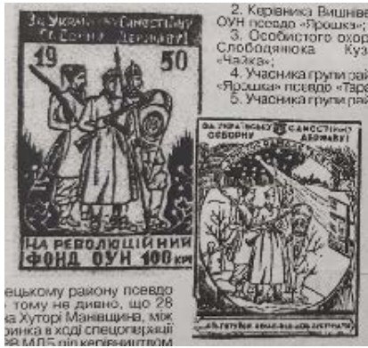
Рис. 1. Ілюстрація до публікації Олійніченко В. Пам'яті героїв. Діалог . 2010. 25 черв. С. 3