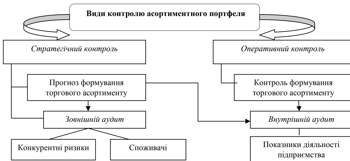
Рис. 1. Види контролю торгового асортименту підприємств роздрібної торгівлі (складено автором самостійно на основі [3])

Підсумовуючи, зауважимо, що вивчення потреб споживачів, систематичне оновлення товарного асортименту та уміння прогнозувати майбутні зміни забезпечить підприємствам роздрібної торгівлі фінансову стабільність та стійкість в умовах гострої конкурентної боротьби.