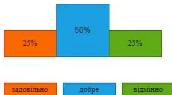
Мал. 1. Результати модульної контрольної роботи № 1

Задачі для практичних занять за темами підбираємо з сайтів MathOlymp, Математичний олімпіадний рух України, Інтернет олімпіада з математики, Всеукраїнська заочна математична олімпіада «5-12», Конкурс Кенгуру. Після кожного змістового модуля проводиться модульна контрольна робота, яка оцінюється в 15 балів. Результати їх проведення відображені на Мал.1, 2.