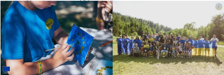
Figure 2. Приклади заходів з популяризації національних і європейських цінностей серед дітей та молоді

Нижче подано ілюстративні приклади фотоматеріалів із проведених спортивно-освітніх та просвітницьких заходів у межах програмного підходу громадської організації. Візуальні матеріали відображають ключові формати діяльності та практичну реалізацію національних і європейських цінностей у роботі з дітьми та молоддю.