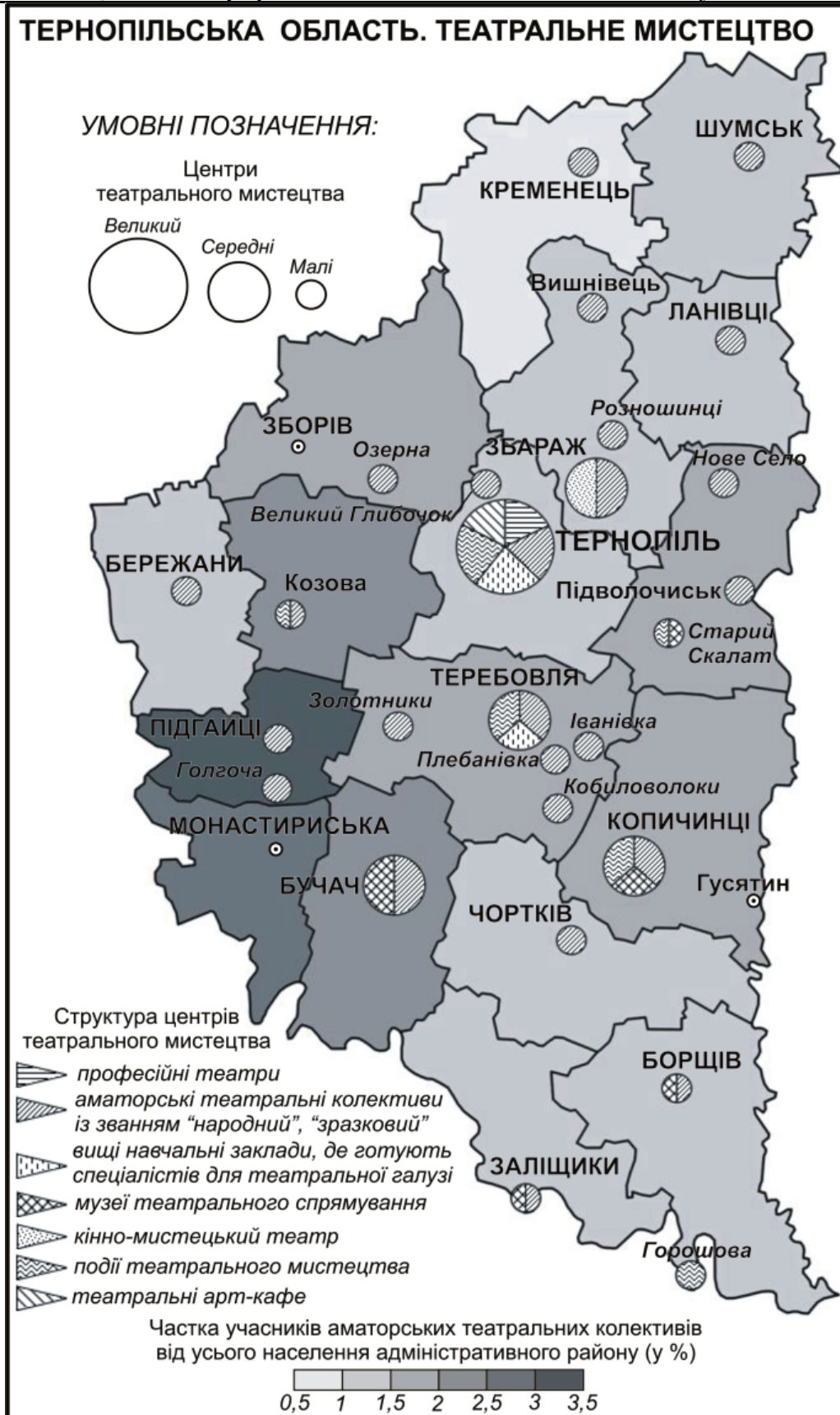
Рис. 3. Театральне мистецтво Тернопільської області

Південний район за показниками розвитку галузі майже подібний із Північним. Тут до-