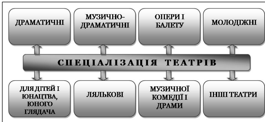
Рис. 1. Функціональна спеціалізація професійних театрів

дожного слова; художньо-просвітницький колектив. Важливим є поділ цих творчих колективів за віком учасників (на дитячий і дорослий) та відповідно на наявність звання ("зразковий" і "народний").