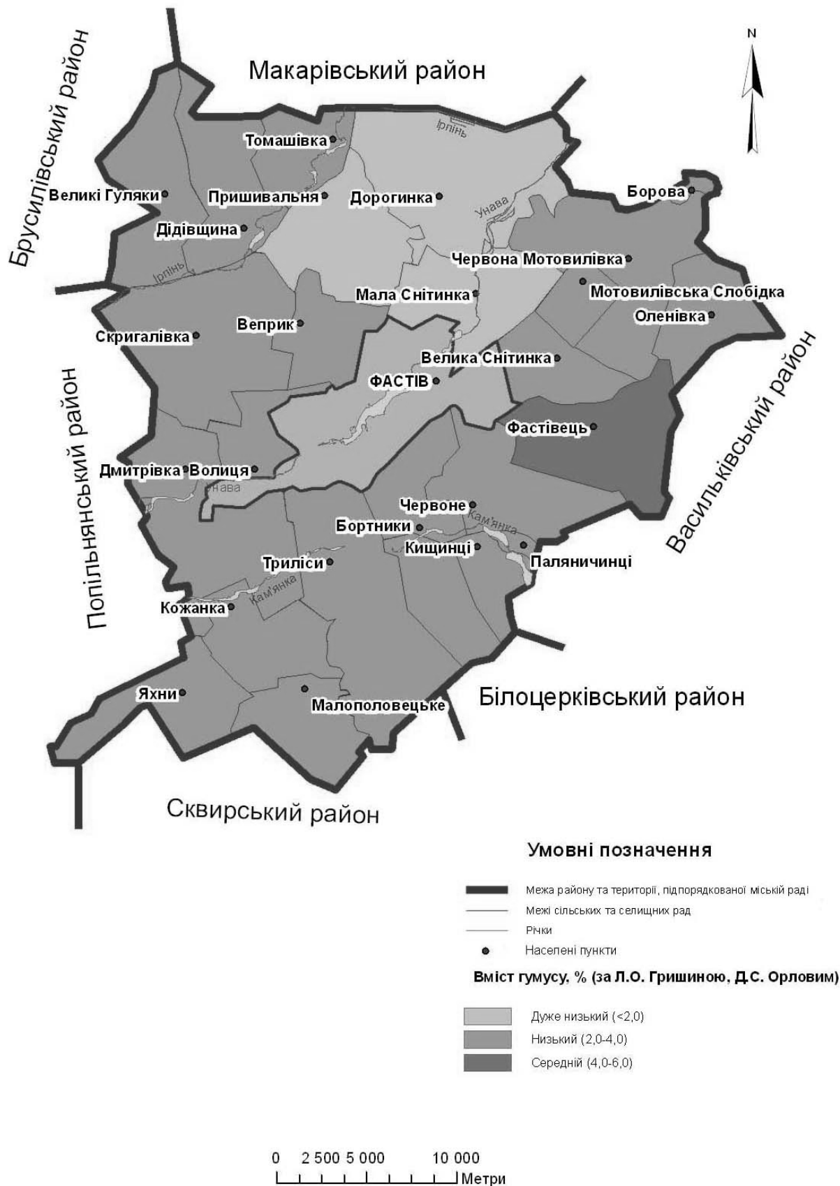
Рис. 1. Середньозважені показники вмісту гумусу у орному шарі ґрунтів Фастівського району Київської області

ким вмістом гумусу (2,0 - 4,0 %) (рис. 1).