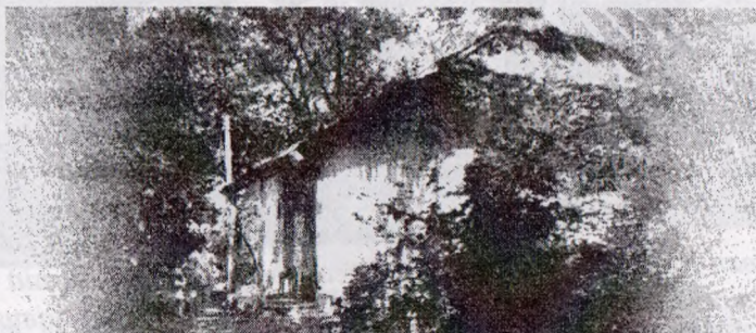
Батьківська хата професора Климишина на хуторі Кутиска, що на Лановеччині.

стало можливим записувати закони збереження на фронті сильної ударної хвилі в компактному вигляді, як і в теорії класичних ударних хвиль. Він вивів формулу для шкали висот, що встановлюється в атмосфері зорі під дією періодичної ударної хвилі. Отримав наближений розв'язок задачі про структуру сильної ударної хвилі з урахуванням ефектів випромінювання; оцінив ефективну температуру фронту такої хвилі; дав оцінку зони іонізаційної релаксації за фронтом і зони прогріву перед фронтом ударної хвилі, що рухається в зоряній атмосфері. Разом з Б. І. Гнатиком у 1980 р. отримав асимптотичну формулу, що описує зміну швидкості руху нестационарної ударної хвилі в неоднорідному середовищі з довільним розподілом густини. І. Климишин здійснив математичний аналіз ефективності теплових хвиль у неоднорідних оболонках зір. Разом із С. А. Капланом отримав кілька розв'язків з теорії нестационарного розсіювання світла в середовищі з рухомою мережею [3: 6].