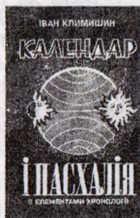
Обкладинки книжок І. Климишина.

Власне за такими моральними законами живе та чинить Іван Антонович і по-філософськи ставиться до зробленого. У зв'язку з цим він згадував про те, що одного разу «хтось мені сказав, що я ось написав стільки-то книжок і вже себе обезсмертив. Я йому відповів: чоловіче добрий, я ж астроном; і перед моїм внутрішнім зором мільйони і мільярди років проковзують наче сухий пісок між пальці рук – то про яке безсмертя ми говоримо?» Тут доречно буде додати ще й роздуми ювіляра в одному з його листів: «Подивуймося Сократові, який, попри свою мудрість, сказав: я знаю, що нічого не знаю. Згадаймо Ньютона, який самому собі здавався хлопчиною, що захоплюється, якщо йому іноді вдається знайти гладенький камінчик, тоді як океан істини, що простягся перед ним, залишається й надалі недосяжним...» [3: 9].