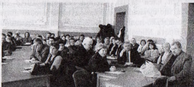
Під час роботи святкової академії в конференц-залі Бережанського агротехнічного інституту