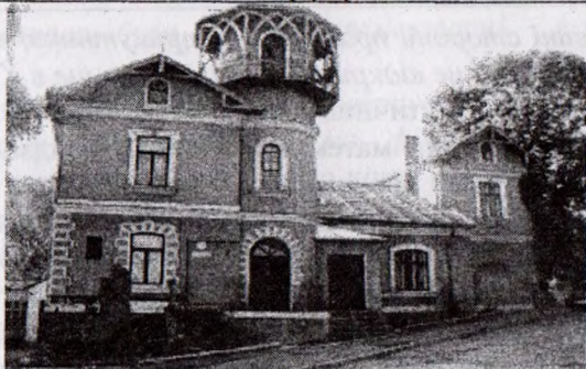
Будинок на вулиці Валові у Бережанах, в якому проживала родина Чайковських.

У батьківській хаті було багато друкованого слова, що зародило у хлопця любов до книги та науки. У спогадах «Мої Бережани» Микола Чайковський писав: