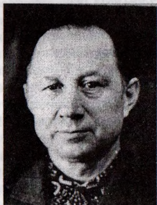
Академік Іван Климишин.

Талановитий професор і академік іноді згадує про те, як у 1975 р. упродовж двох тижнів йому кілька разів телефонував голова комісії з астрономії при Міністерстві освіти СРСР професор В. В. Радзівеський, агітуючи від імені Міністерства перейти на посаду завідувача кафедри астрономії у Московському пединституті. Як у 1981 р. голова ради з підготовки астрономічних кадрів при Академії наук СРСР В.В. Соболев так само наполегливо агітував нашого землянина перейти на посаду завідувача кафедри астрономії Київського державного університету імені Т. Шевченка. Але «поїхати так далеко від батьків, від рідного села хтось, можливо, й здатен, але я – ні!» [3: 8]. Найцікавіше, очевидно, те, що професор Климишин у 1974 р. відхилив чотири рази повторену академіком Я. С. Підстригачем пропозицію перейти у створюваний ним науководослідний інститут на посаду завідувача відділу, з удвічі більшим окладом і перспективою через три-чотири роки стати член-кором АН УРСР.