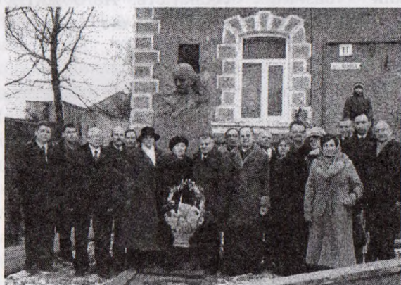
Учасники святкової академії біля родинного будинку Миколи Чайковського в Бережанах