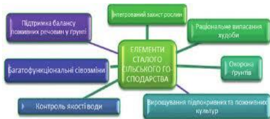
Рис. 4. Складові системи органічного рослинництва

Отже, екологізація агровиробництва є необхідною умовою збереження природного потенціалу, підвищення якості продукції та забезпечення екологічної безпеки. Її реалізація потребує комплексного підходу, що поєднує наукові, технологічні, економічні та соціальні аспекти.