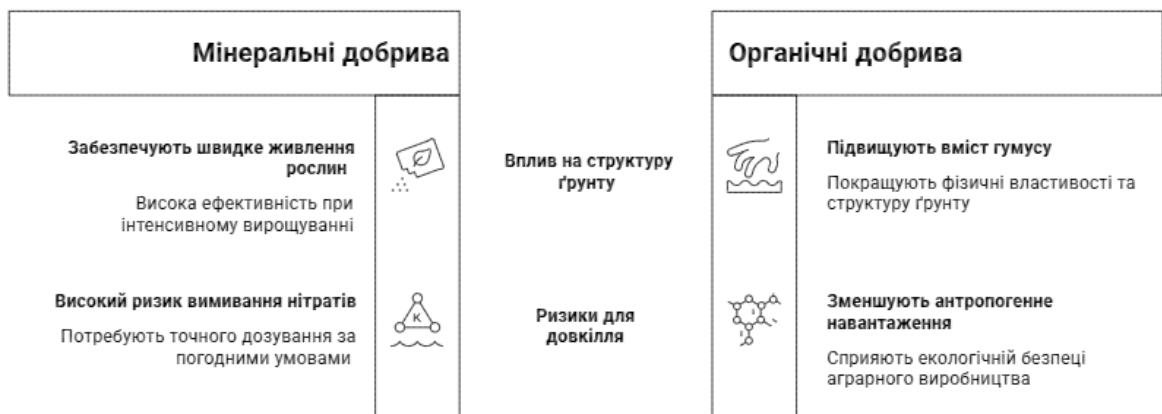
Рис. 2. Екологічні наслідки використання добрив

Важливим напрямом є впровадження науково обґрунтованих систем удобрення , які передбачають поєднання мінеральних і органічних добрив (рис. 2). Використання органічної речовини (гною, компостів, сидератів) сприяє підвищенню вмісту гумусу, покращенню структури ґрунту та зменшенню потреби у мінеральних добривах [17, с. 104]. Це особливо актуально для чорноземів і сірих лісових ґрунтів Тернопільської області, які зазнають поступової деградації при інтенсивному використанні.