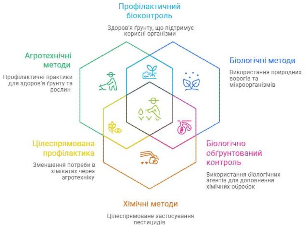
Рис. 3. Синергія методів для стійкого захисту рослин

У межах інтегрованого захисту рослин важливе значення має використання стійких сортів, дотримання сівозмін, оптимізація строків посіву та обробітку ґрунту. Біологічні методи передбачають використання ентомофагів, мікроорганізмів та біопрепаратів, які знижують чисельність шкідників без шкоди для довкілля [18, с. 212]. У Тернопільській області ці методи можуть бути ефективно реалізовані завдяки сприятливим природним умовам.