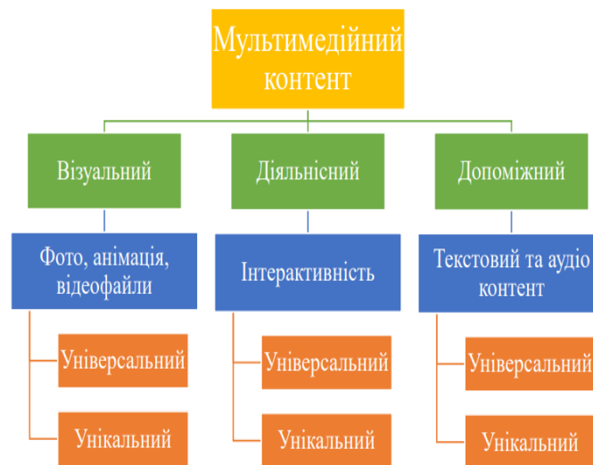
Рис. 2.1 Напрями використання мультимедійного контенту

3. Допоміжний – текст та аудіоконтент доповнюють освітній процес, пояснюючи ключові терміни, правила та алгоритми роботи. Аудіофайли можуть бути використані для додаткових пояснень або в супроводі до відео, що підвищує доступність інформації.