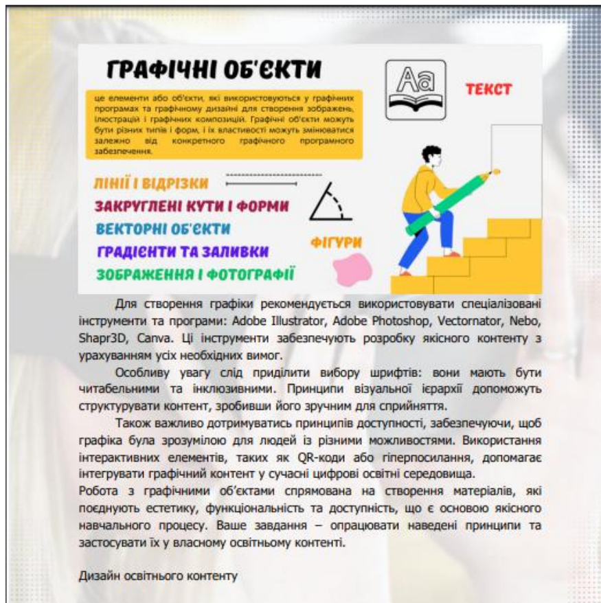
Рис. 2.2 Ілюстрація пропонованого теоретичного матеріалу