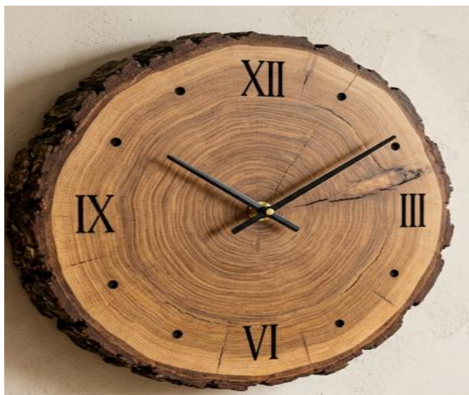
Рис. 2.2. Декоративний годинник зі зрізу деревини

Розглянемо процес виготовлення декоративного годинника зі зрізу стовбура дерева. Такий виріб може бути виконаний як у класичній квадратній формі, так і в оригінальному сучасному стилі. Наприклад, основою може слугувати асиметричний тонкий зріз деревини. Зразок подібного годинника наведено на рис. 2.2 . Під час дистанційного навчання учні можуть займатися розробкою дизайну виробу, тоді як практичне виготовлення доцільно проводити у навчальних майстернях.