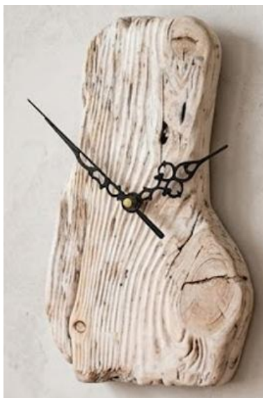
Рис. 2.8. Приклад виготовленого годинника в стилі

Стрілки для годинника слід встановлювати по черзі у такому порядку: спочатку годинну, потім хвилинну і в останню чергу секундну. Кожну стрілку слід акуратно притискати до своєї осі, доки не відчуємо легкий «кляц». Після встановлення варто перевірити, щоб стрілки не торкались одна одної та не зачіпали циферблат. Приклад зібраного годинника подано на рис 2.8.