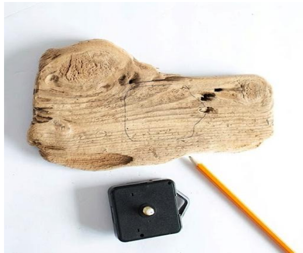
Рис 2.5. Розмітка під механізм

За допомогою стамески та молотка поступово потрібно вибрати деревину всередині розмітки (рис 2.6). Цю операцію рекомендуємо виконати під час очного навчання в школі, однак за наявного відповідного обладнання вдома, окремі учні можуть це зробити вдома після вивчення відповідних інструктажів з техніки безпеки при роботі зі стамесками та іншим ріжучими інструментами. Учням Для зручності можна рекомендувати зафіксувати основу руками або затискачем. Постійно варто контролювати глибину, орієнтуючись на довжину осі механізму. Заглиблення робити слід таким чином, щоб частина осі залишалася виступати з лицьового боку.