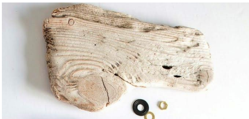
Рис. 2.4. Підготовлена основа для годинника в стилі дріфтвуд

Наступним кроком є підготовка основи (рис 2.4). Вважаємо що в умовах дистанційного навчання учні вдома можуть підготувати та просушити цю деревину. За потреби поверхню слід прошліфувати, щоб прибрати різкі нерівності. Головне, зберегти природну фактуру, адже саме вона формує вигляд виробу. У підсумку отримуємо підготовлену основу для майбутнього годинника. Якщо деревина здається занадто світлою, можна порекомендувати учням втерти у неї звичайну каву або міцну чайну заварку. Після висихання поверхню слід покрити воском і, текстура стане благородною і старою. Операцію з покриттям воском в умовах очного навчання можна робити в школі, а в умовах дистанційного навчання за умов проведення відповідних інструктажів з охорони праці учні можуть зробити вдома самостійно.