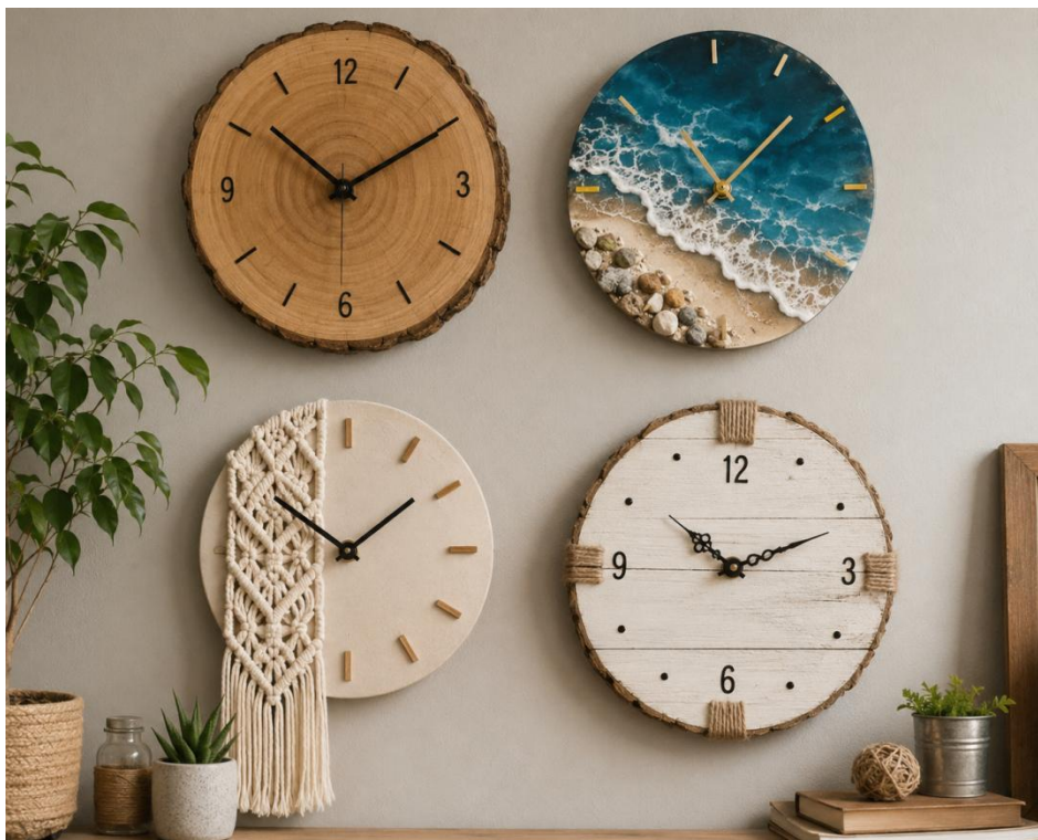
Рис. 2.1. Інтер'єрні годинники

Є різні види годинників (Класичні, Інтер'єрні, сучасні, наручні тощо). Ми беремо за основу Інтер'єрні годинники. Для їх виготовлення зазвичай використовують дерево або фанеру. Форма, колір і декоративне оформлення залежать від стилю приміщення та особливостей інтер'єру. Приклад Інтер'єрних годинників показано на рис. 2.1 .