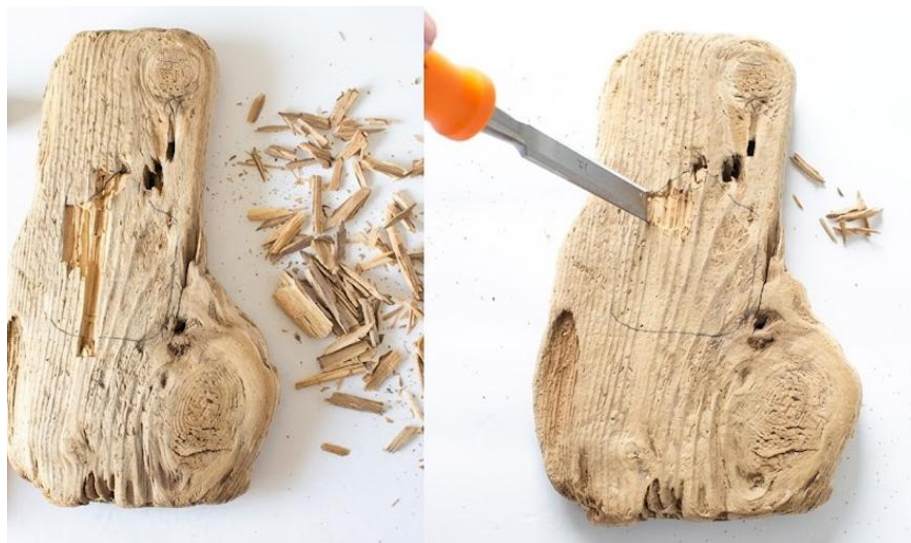
Рис. 2.6. Вирізування стамескою заглибини під годинниковий механізм

За допомогою стамески та молотка поступово потрібно вибрати деревину всередині розмітки (рис 2.6). Цю операцію рекомендуємо виконати під час очного навчання в школі, однак за наявного відповідного обладнання вдома, окремі учні можуть це зробити вдома після вивчення відповідних інструктажів з техніки безпеки при роботі зі стамесками та іншим ріжучими інструментами. Учням Для зручності можна рекомендувати зафіксувати основу руками або затискачем. Постійно варто контролювати глибину, орієнтуючись на довжину осі механізму. Заглиблення робити слід таким чином, щоб частина осі залишалася виступати з лицьового боку.