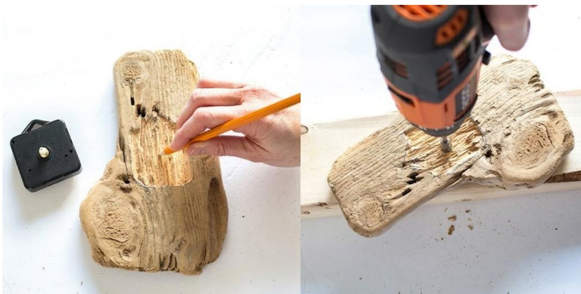
Рис. 2.7. Розмітка та свердління отвору

Учням тут варто зауважити, що інколи помилково роблять заглиблення на всю товщину механізму, але насправді механізм має трохи втопитися, але його вісь має виходити далі на 5–8 мм для фіксації шайби та подальшого кріплення стрілок. Далі учні повинні позначити місце отвору для кріплення годинникового механізму на заготовці (рис.2.7). Дрилем із свердлом трохи більшого діаметра, ніж вісь механізму слід зробити отвір у центрі заготовки наскрізь. Свердло варто підбирати так, щоб вісь проходила вільно, але не хиталася. У результаті отримуємо рівний отвір для встановлення. Обов'язково необхідно перевірити чистоту країв, за потреби обробити шліфшкуркою.