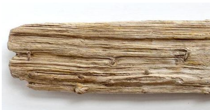
Рис. 2.3 Деревина для виготовлення годинника в стилі дріфтвуду

Розкриємо детальніше особливості виготовлення цього годинника в умовах змішаного навчання з урахуванням вимог охорона праці. Спочатку перелічимо матеріали та інструменти для створення годинника: плоский шматок дріфтвуду або будь-якої зістареної деревини (рис 2.3.) (приблизно 25 × 10 см, товщина 2–2,5 см) годинниковий механізм, стрілки для годинника, стамеска середнього розміру, молоток, дріль і свердло відповідного діаметра.