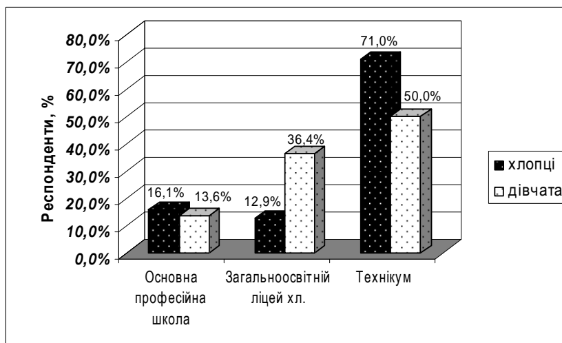
Рис. 2. Результати визначення освітньо-професійних намірів гімназистів м. Пороховіци

На цій підставі зроблено висновок про значний вплив зазначеного чинника на освітньо-професійні прагнення цієї групи молоді. Учні, які вибрали загальноосвітній ліцей, було значно менше, але показник різниці між вибором дівчат і хлопців склав 23,5 %.