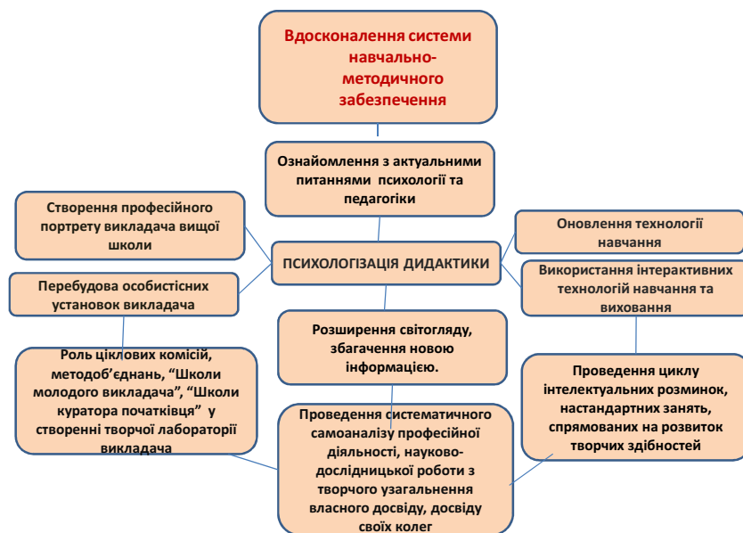
Рис.3. Вдосконалення системи наукового, навчально-методичного забезпечення.

Ці зміни залежать від дії основних психологічних чинників, до яких слід віднести наступні: готовність студентів до сприйняття сучасних освітніх технологій та позитивна мотивація навчальної діяльності в цій ситуації; готовність викладачів і студентів до творчої діяльності; оптимальний психологічний клімат освітнього процесу та майстерність педагогів; врахування психологічних аспектів управління вищим навчальним закладом [2].