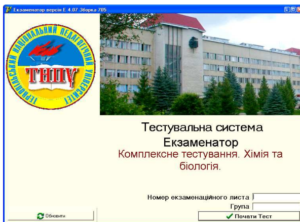
Рис. 1. Стартове вікно програми

ційними середовищами. Тестова система дає можливість одночасно використовувати усі наявні сучасні мережеві засоби on-line телекомунікації. Відповідно до вимог, як прикладне програмне забезпечення, АС «Екзаменатор» має дві складові: для викладачів і студентів. Комп'ютерна програма також передбачає можливість створення електронної бази навчальних контролюючих матеріалів.